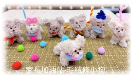
家長加油站-毛絨條小狗