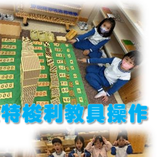
蒙特梭利教具操作