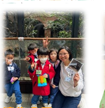
參觀香港動植物公園