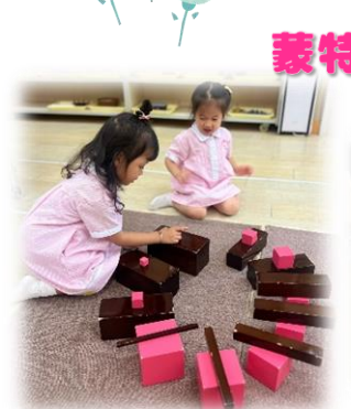
蒙特梭利教具操作