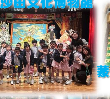
參觀沙田文化博物館