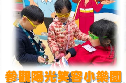
參觀陽光笑容小樂園