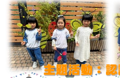
主題活動：認識春天