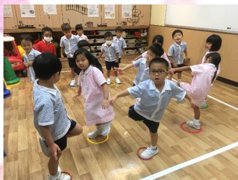
▲ 看看我可以單腳跳起，我真棒！