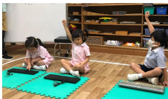
◀ 找到了！ 找到 tie！