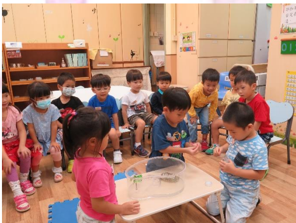
▲ 烏龜，我餵你食龜糧呀！