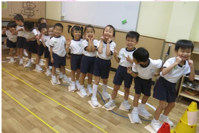
▲ 我們今天很開心！ ▼ 玩具分類大賽開始！