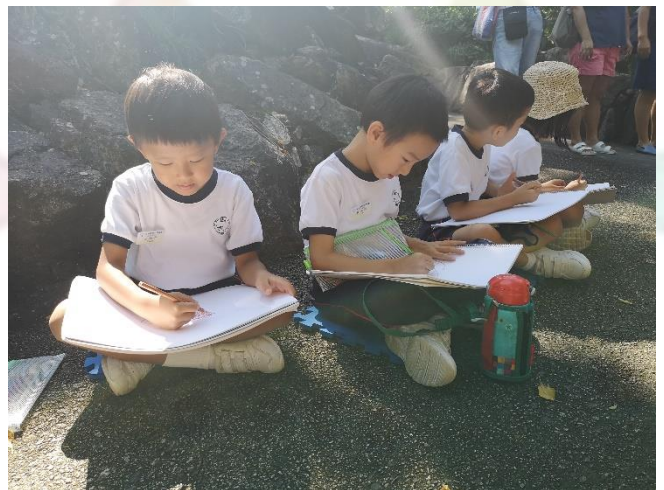
▲ 天父的創造真奇妙！ ▼ S...s...sodal!