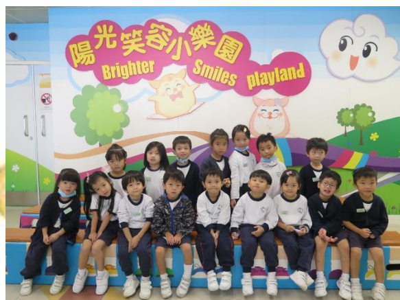
參觀陽光笑容小樂園。 ➤