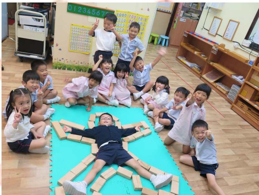
▲ 我們一起用積木砌人的外形。