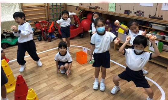
▲ 看！我們準備好太空大戰！