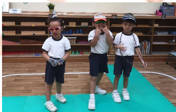
▲ I am the smartest giant in the town!