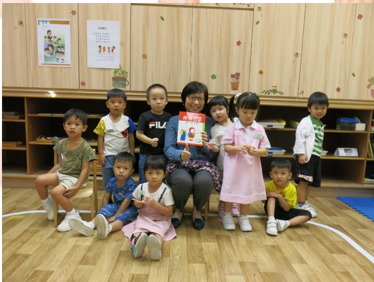
▲ 周校長與我們分享故事。