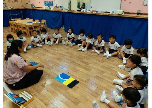
▲ 我們一起認識天父的創造。