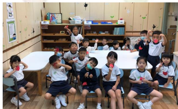
▲ This is a letter N...Necklace!