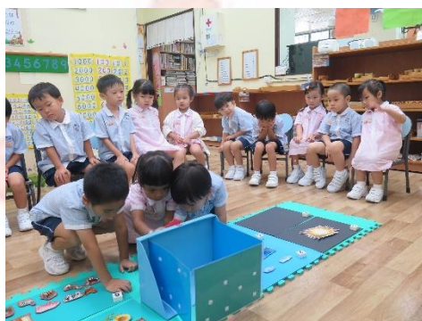
▲ 我們喜歡天父的創造！