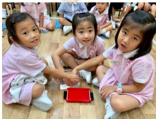
◀ 齊來探索空氣實驗。