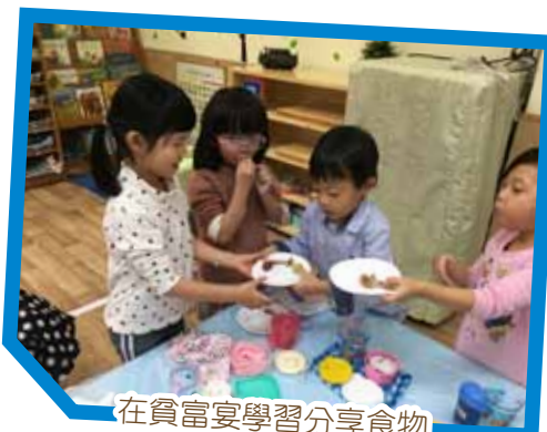
在貧富宴學習分享食物