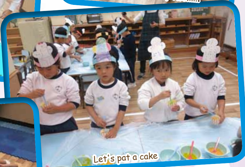
Let's pat a cake