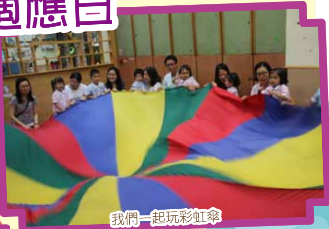
我們一起玩彩虹傘