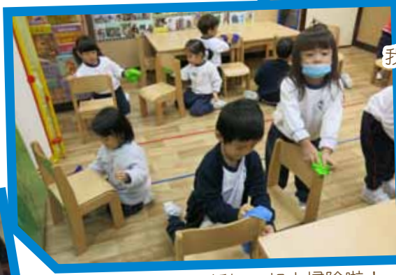
新年一起大掃除啦!