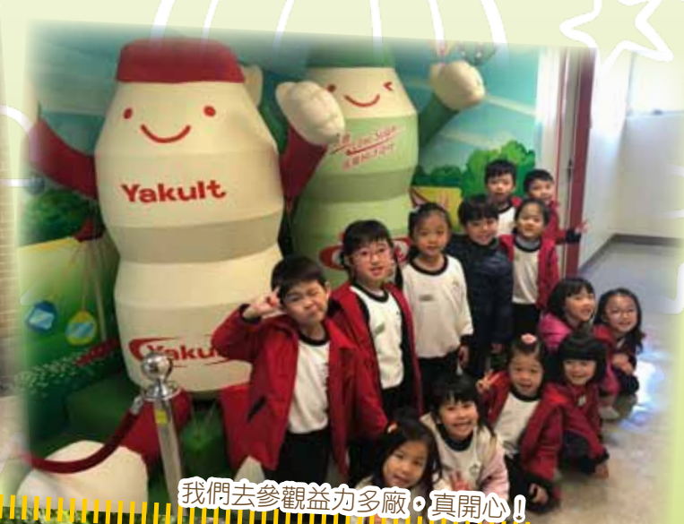
我們去參觀益力多廠，真開心！