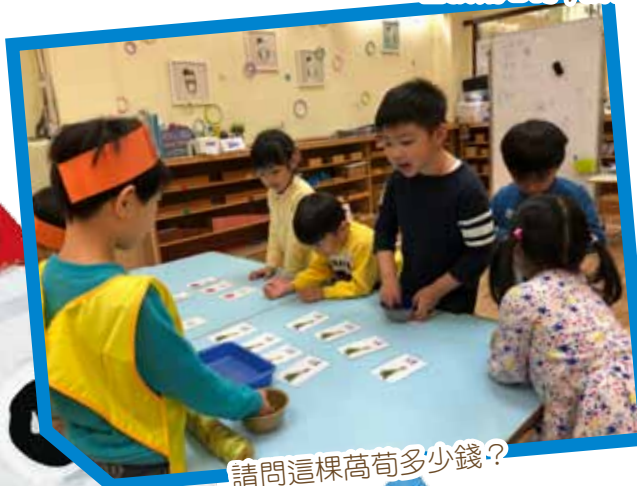
請問這棵萵苣多少錢?