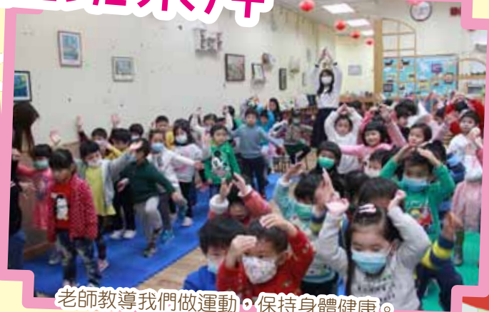
老師教導我們做運動，保持身體健康。