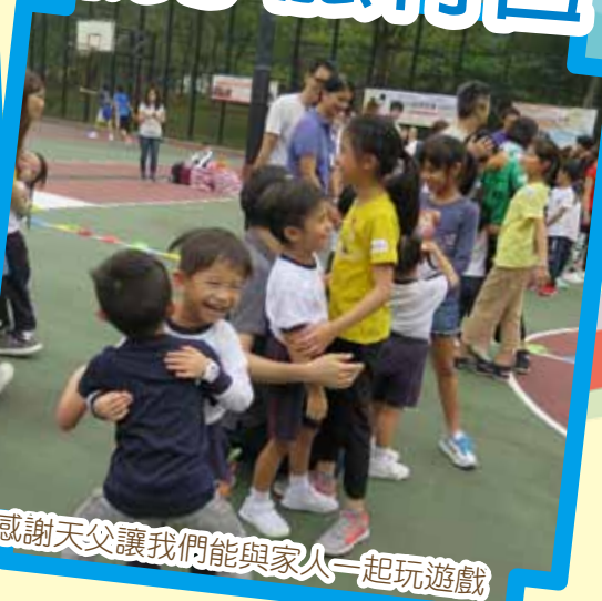
感謝天父讓我們能與家人一起玩遊戲