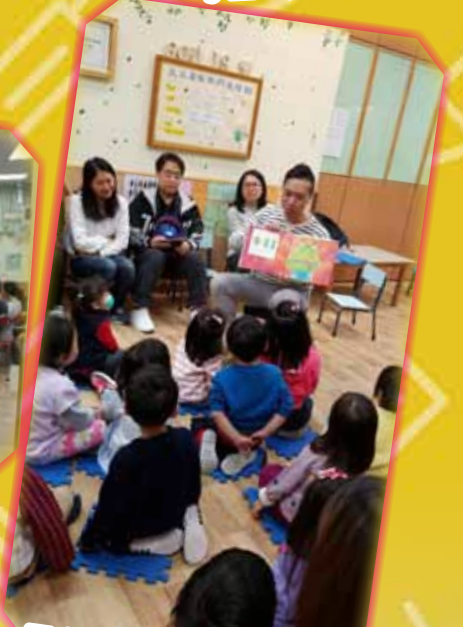
平安閱讀會今次由爸爸為小朋友講故事