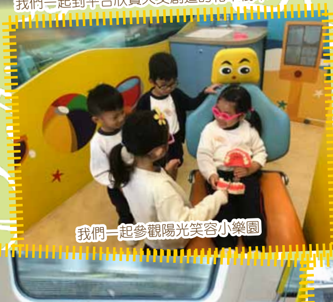
我們一起參觀陽光笑容小樂園