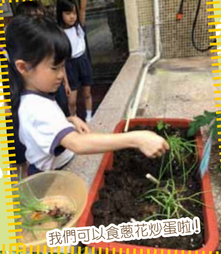
我們可以食蔥花炒蛋啦！