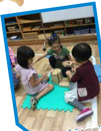
我們同來合作建房屋!