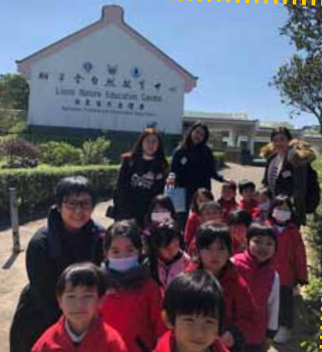
我們一起去參觀昆蟲館，看看蝴蝶的成長。