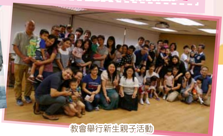
教會舉行新生親子活動