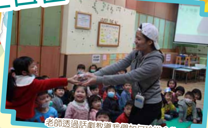
老師透過話劇教導我們如何珍惜食物