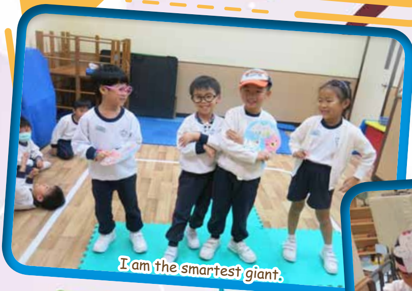
I am the smartest giant.