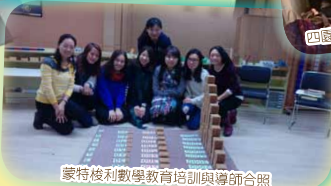
蒙特梭利數學教育培訓與導師合照