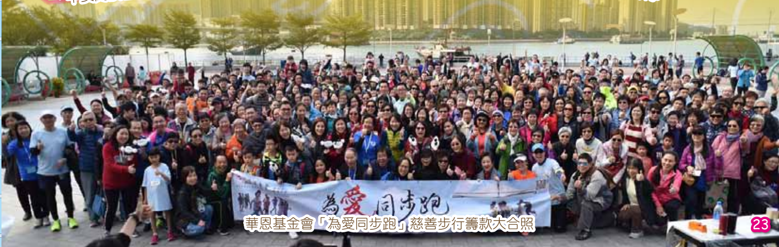
華恩基金會「為愛同步跑」慈善步行籌款大合照