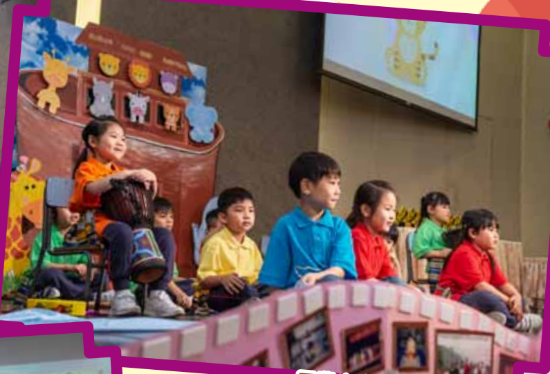
畢業生「節奏組」精彩表演