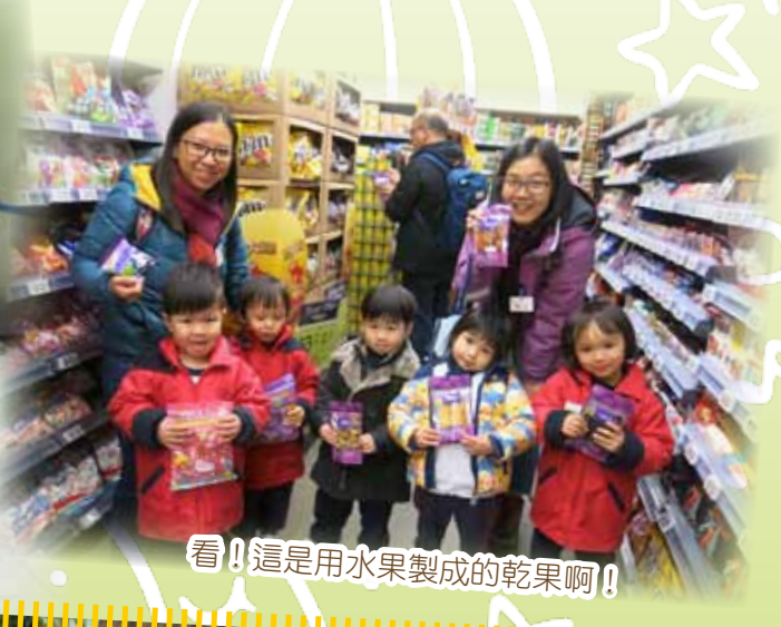
看！這是用水果製成的乾果啊！