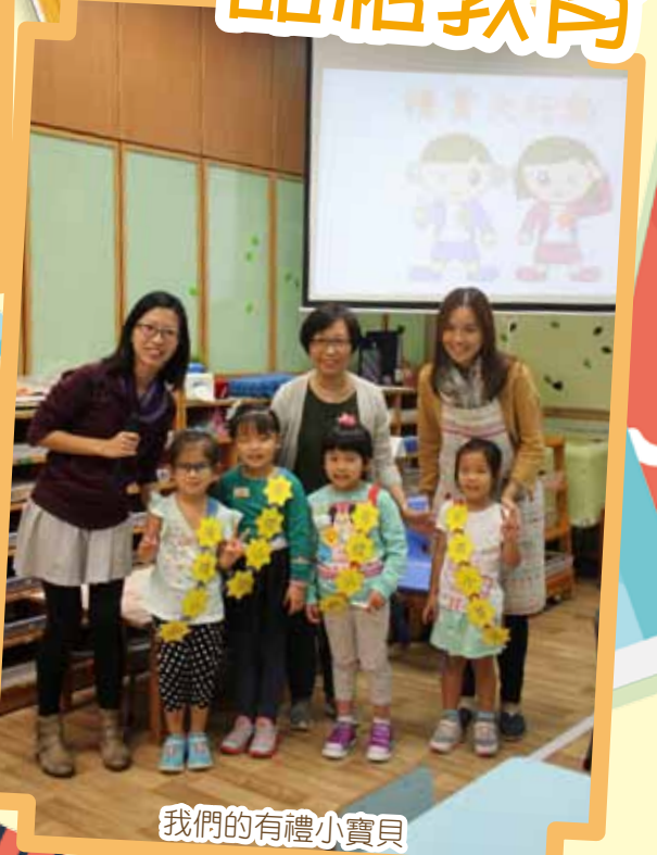
我們的有禮小寶貝