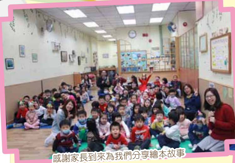
感謝家長到來為我們分享繪本故事