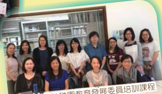
平安福音堂幼稚園教育發展委員培訓課程