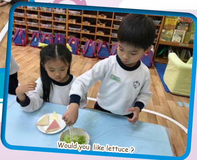
Would you like lettuce?