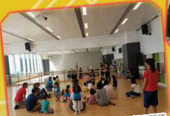
「平安閱讀會」在體育館進行親子閱讀