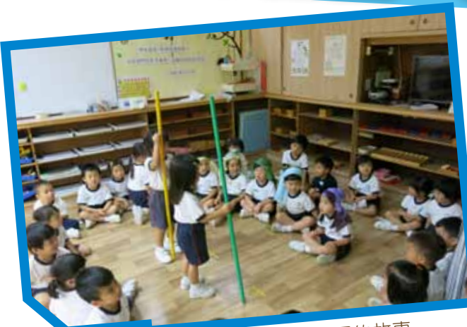
我們在扮演掃羅的故事