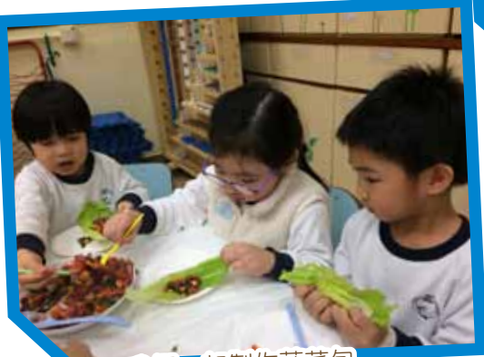
我們一起製作蔬菜包