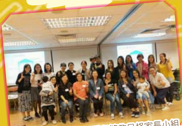
上午班家長完成「6A 愛與管教品格家長小組」