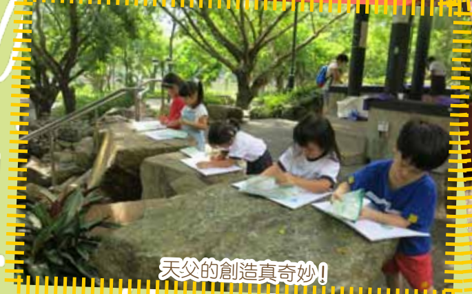
天父的創造真奇妙！