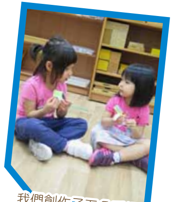
我們創作了五色手鐲，並練習向人傳福音。