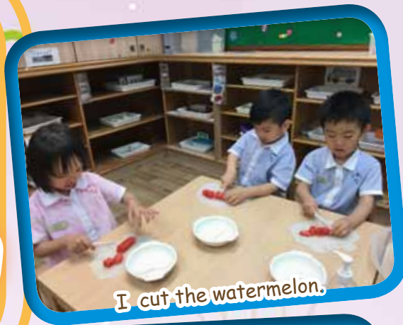
I cut the watermelon.