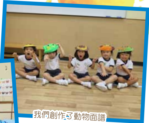
我們創作了動物面譜