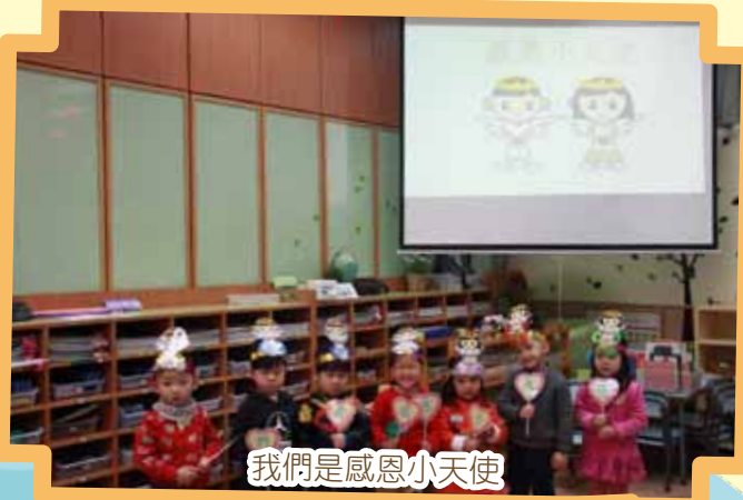
我們是感恩小天使