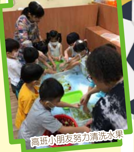
高班小朋友努力清洗水果