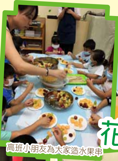
高班小朋友為大家造水果串