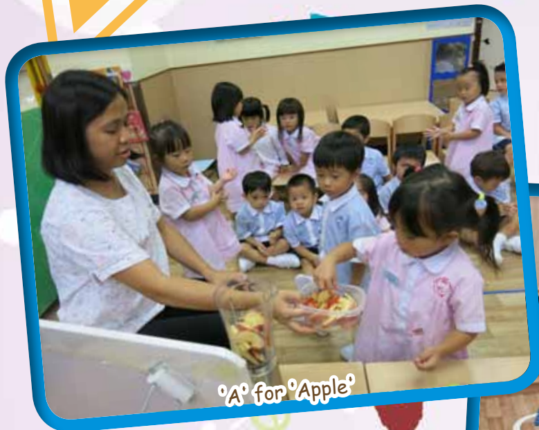
'A' for 'Apple'