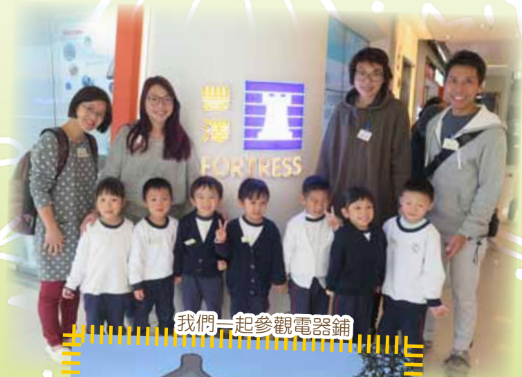
我們一起參觀電器舖