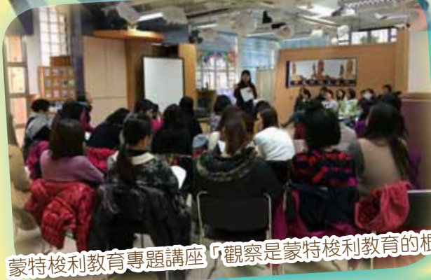
蒙特梭利教育專題講座「觀察是蒙特梭利教育的根」