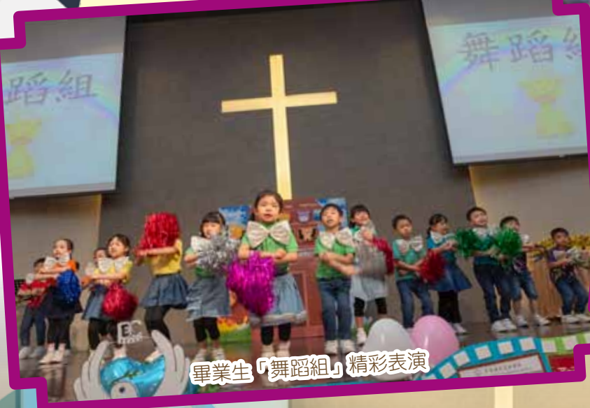
畢業生「舞蹈組」精彩表演