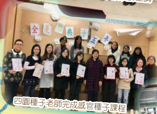
四園種子老師完成感官種子課程