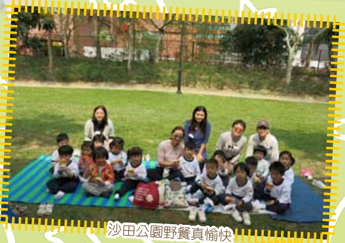
沙田公園野餐真愉快