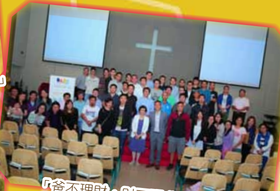
「爸不理財·財不理爸」家長講座