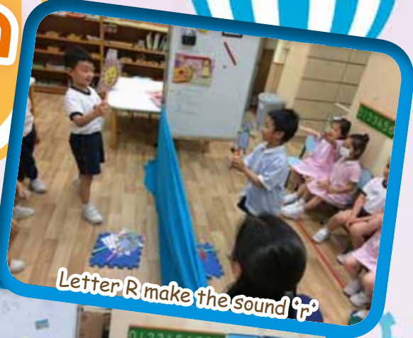
Letter R make the sound 'r'