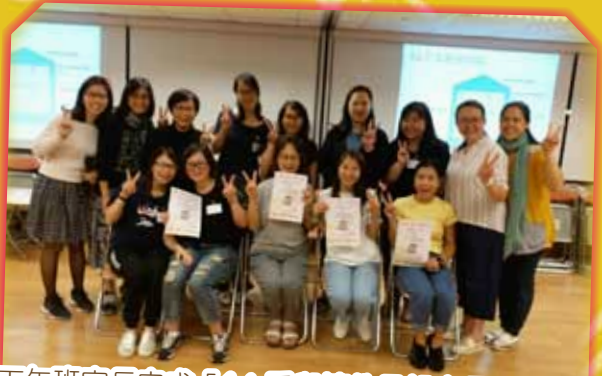
下午班家長完成「6A 愛與管教品格家長小組」