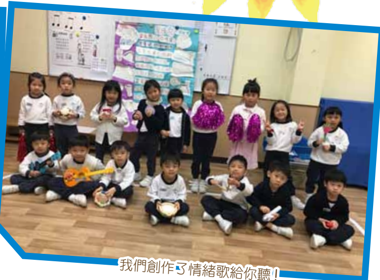
我們創作了情緒歌給你聽!