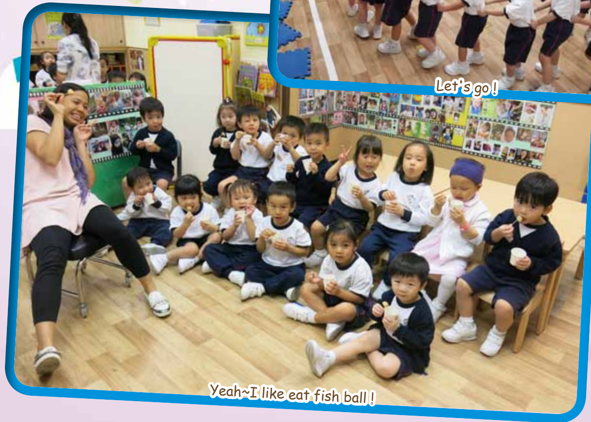
Yeah~I like eat fish ball!