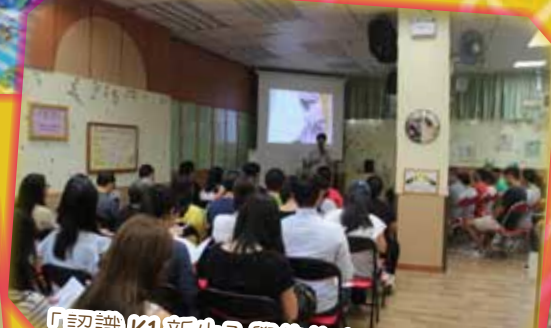
「認識K1 新生入學的焦慮情緒與基本應對舒緩技巧」家長講座