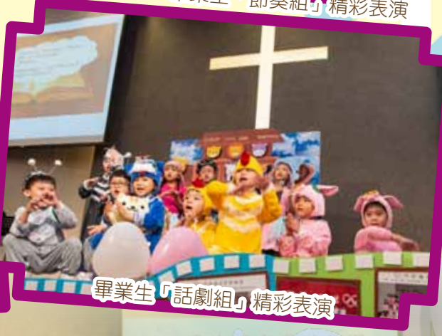
畢業生「話劇組」精彩表演