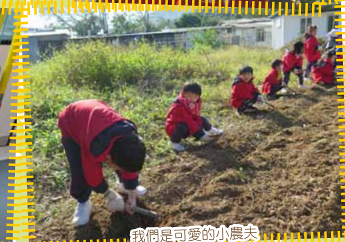
我們是可愛的小農夫