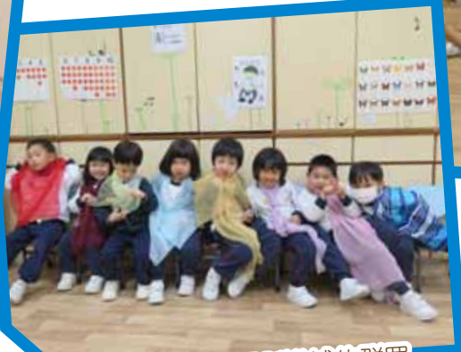
我們在扮演等候耶穌進城的群眾