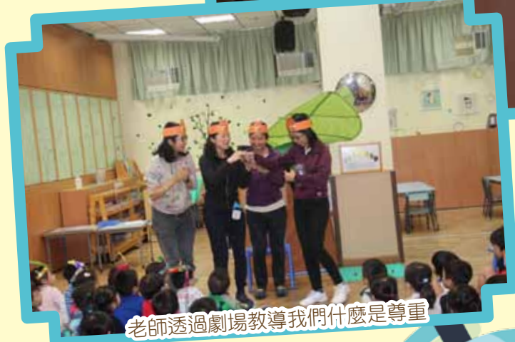
老師透過劇場教導我們什麼是尊重