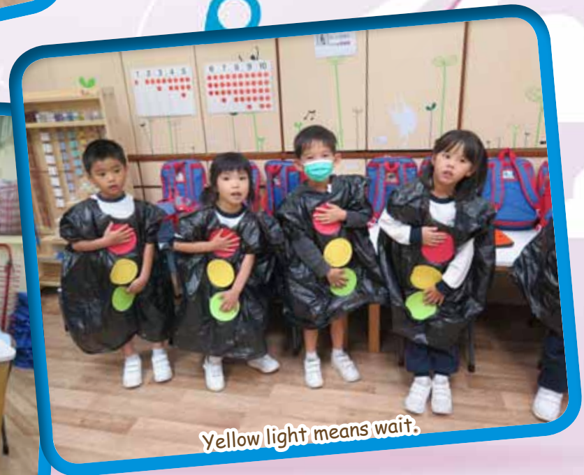
Yellow light means wait.