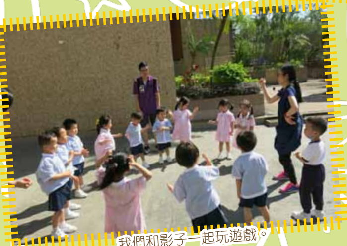
我們和影子一起玩遊戲。