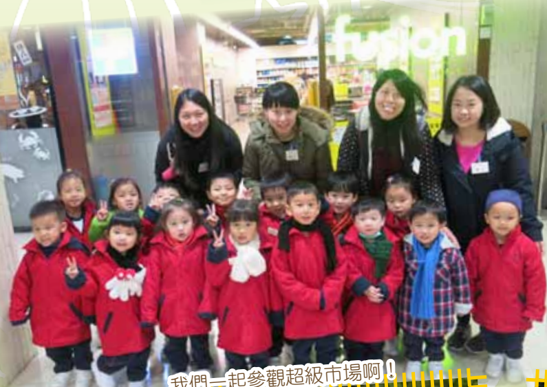
我們一起參觀超級市場啊！