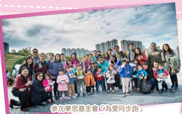
參加華思基金會「為愛同步跑」慈善步行籌款家庭