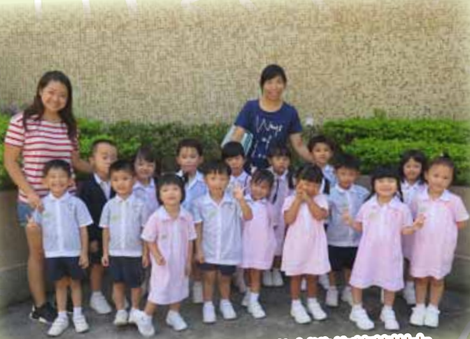
我們一起到平台欣賞天父創造的花草樹木