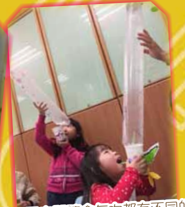
平安閱讀會每次都有不同的手工·很好玩呢!