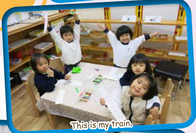
This is my train.