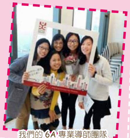
我們的 6A 專業導師團隊

今年平安福音堂幼稚園（沙田）雖已進入第 30 個年頭，但我們仍一直堅持著以聖經的原則教導學生，培養出神和人喜悅的孩子，我們深信惟有神的愛，能使家庭得著永恆的福樂；父母若能行在神的道路上，在教養子女時，必然恩上加恩，力上加力！