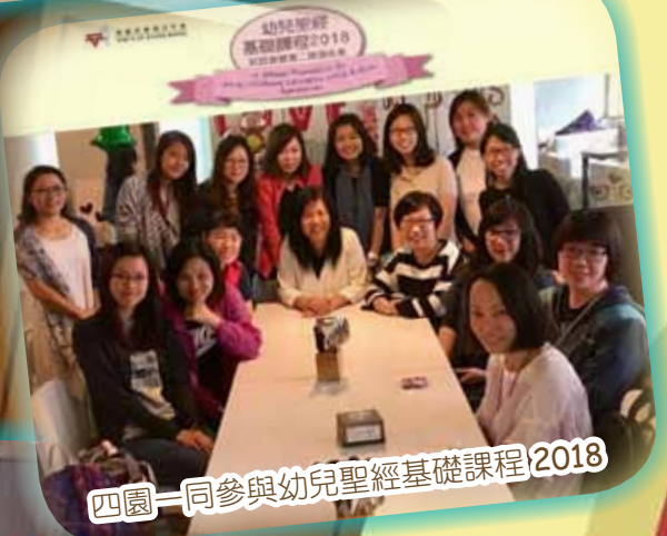
四園一同參與幼兒聖經基礎課程2018