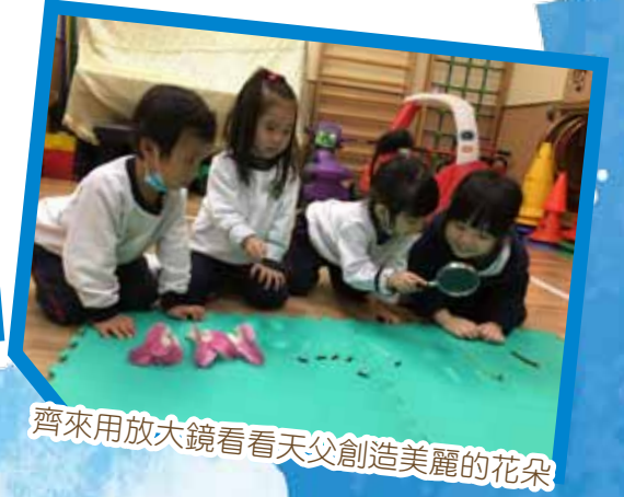
齊來用放大鏡看看天父創造美麗的花朵