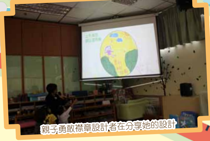
親子勇敢襟章設計者在分享她的設計