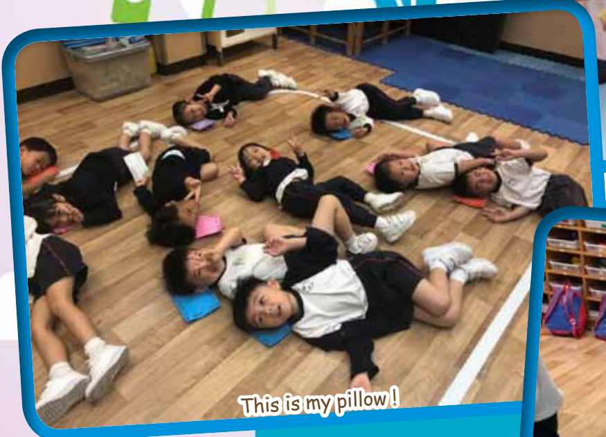
This is my pillow!