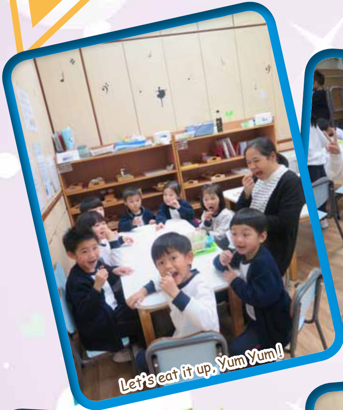
Let's eat it up, Yum Yum!