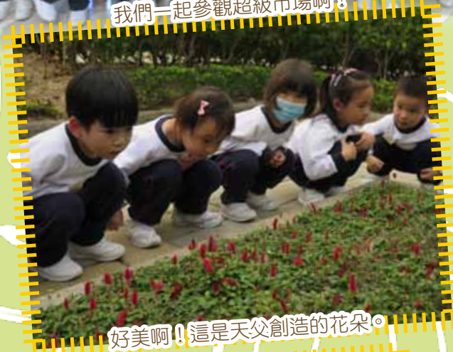
好美啊！這是天父創造的花朵。