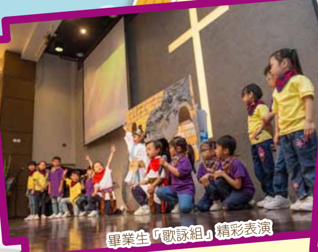
畢業生「歌詠組」精彩表演