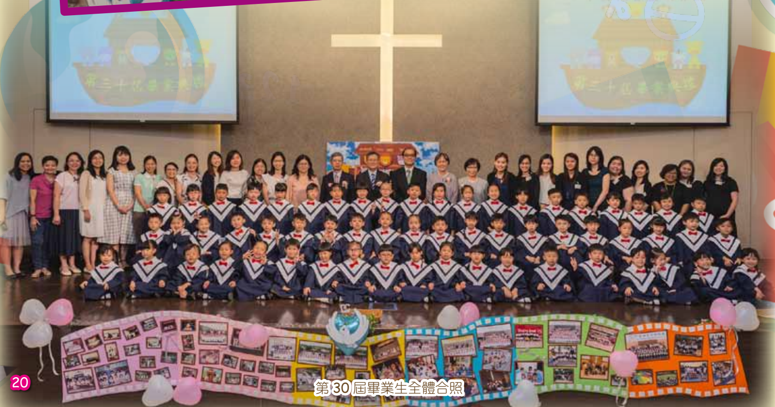
第30屆畢業生全體合照