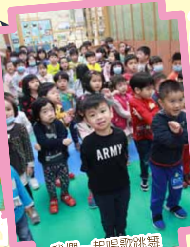
我們一起唱歌跳舞