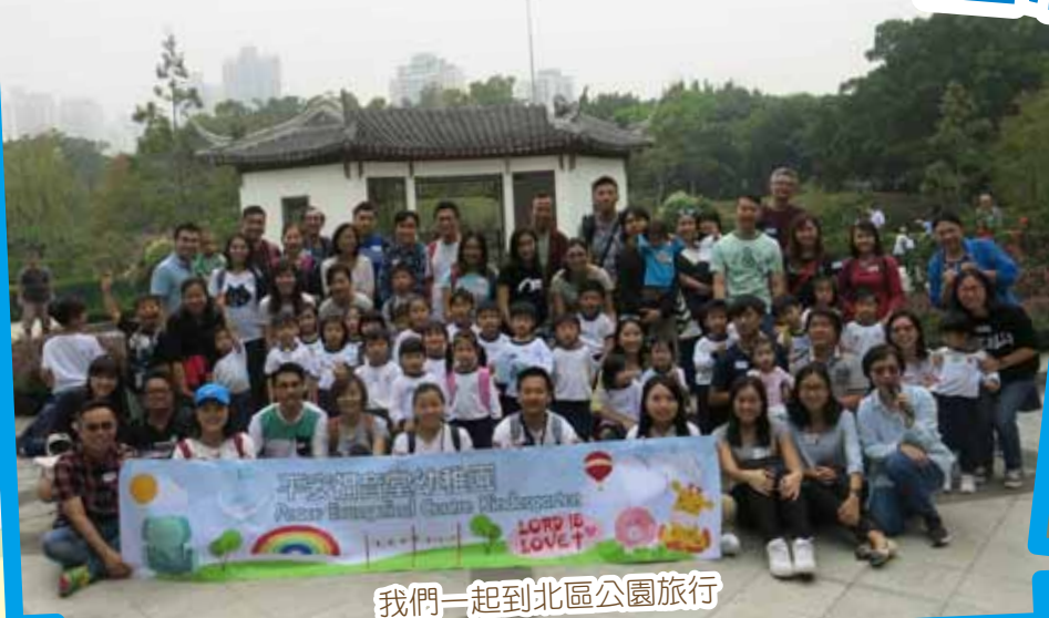
我們一起到北區公園旅行