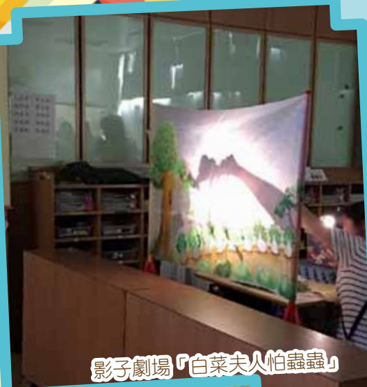
影子劇場「白菜夫人怕蟲蟲」