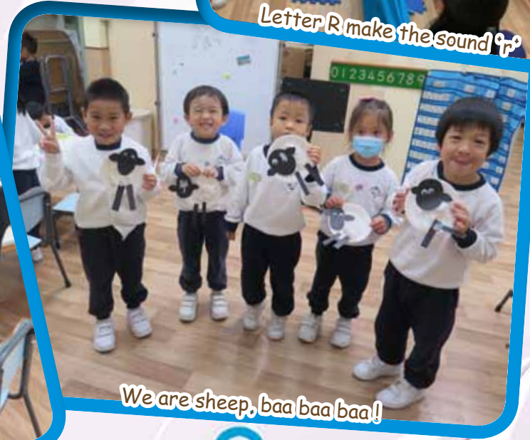
We are sheep, baa baa baa!