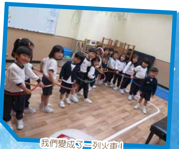
我們變成了一列火車！