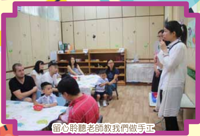
留心聆聽老師教我們做手工