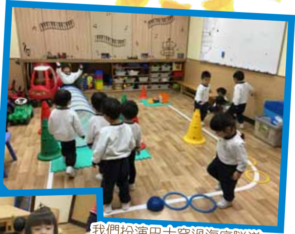
我們扮演巴士穿過海底隧道