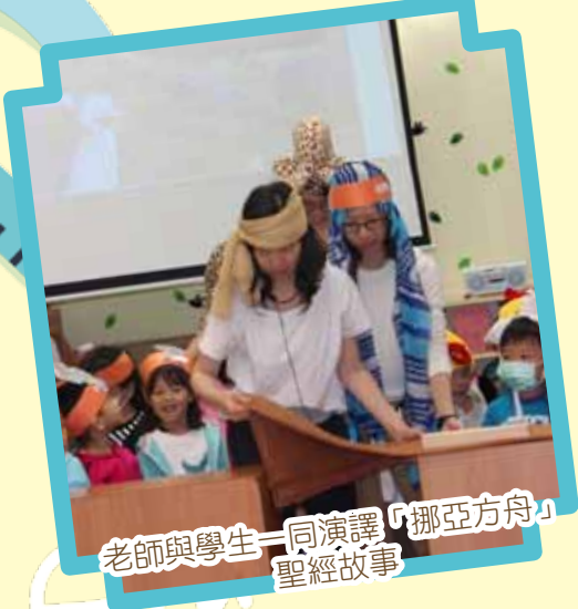
老師與學生一同演譯「挪亞方舟」 聖經故事