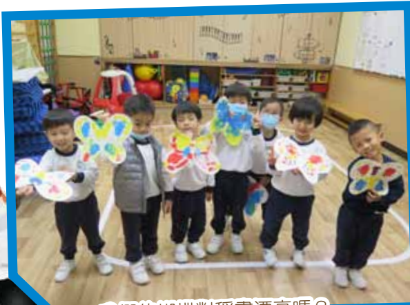
我們的蝴蝶對稱畫漂亮嗎？