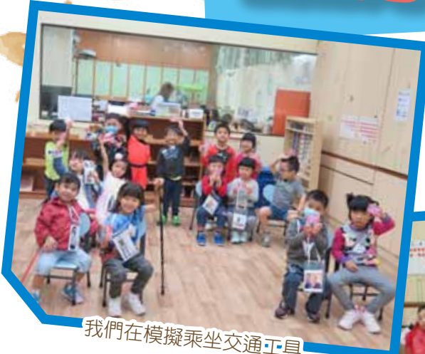
我們在模擬乘坐交通工具