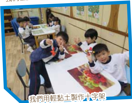
我們用輕黏土製作十字架