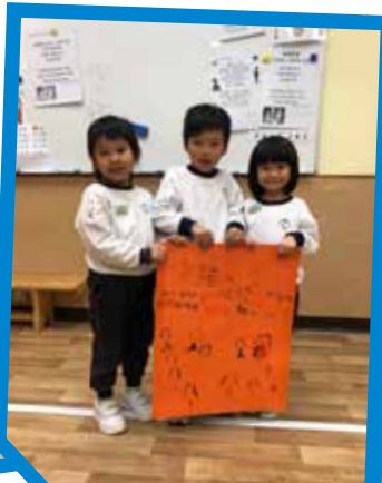
這是我們設計的情緒大書!