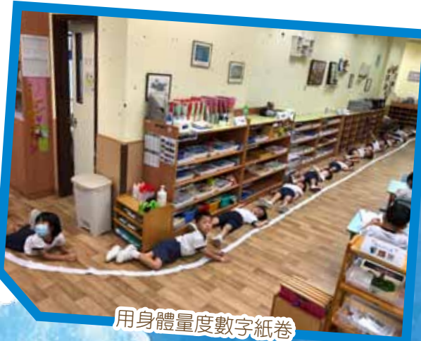
用身體量度數字紙卷