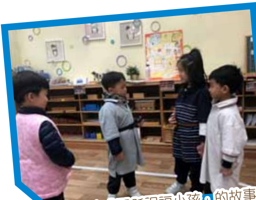
我們在扮演「耶穌祝福小孩」的故事