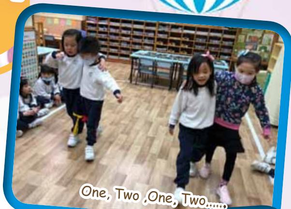
One, Two, One, Two.....