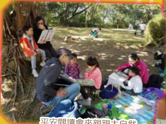
平安閱讀會來親親大自然