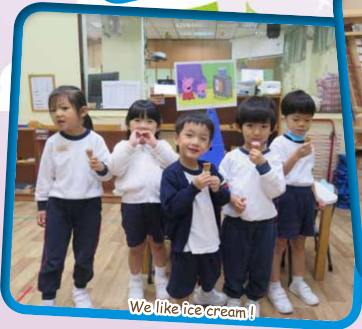
We like ice cream!