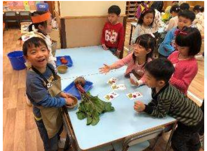
▲ 請問這棵紅菜頭多少錢？