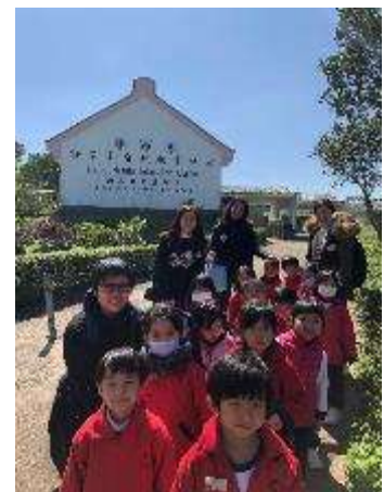
▲ 我們一起去參觀昆蟲館。