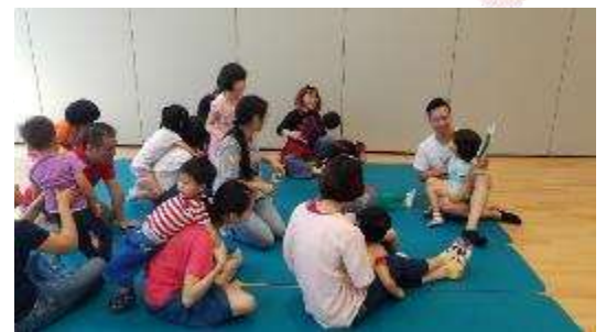
平安閱讀會外出活動。