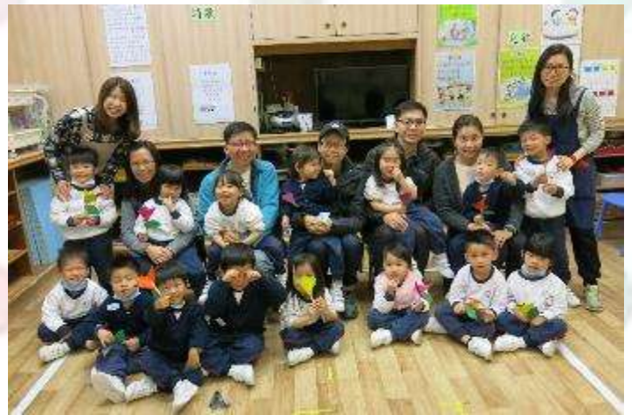
▲ 爸爸媽媽來探望我們，真開心！