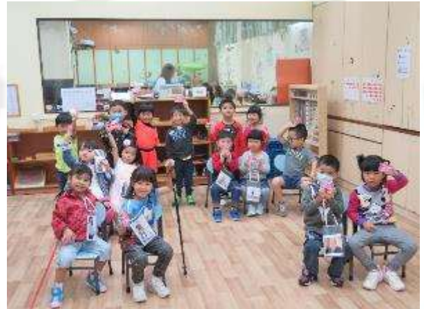
▲ 我們在模擬乘坐交通工具。