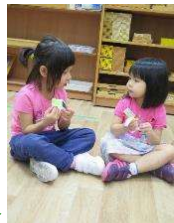
我們用五色手鐲練習向人傳福音。 ➤