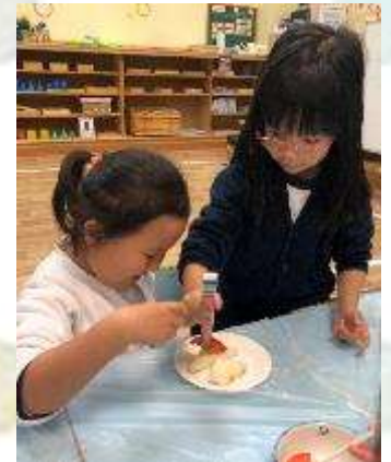
▲ Would you like some cheese ?