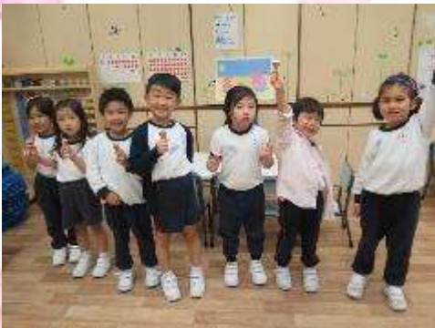
▲ We like ice cream.