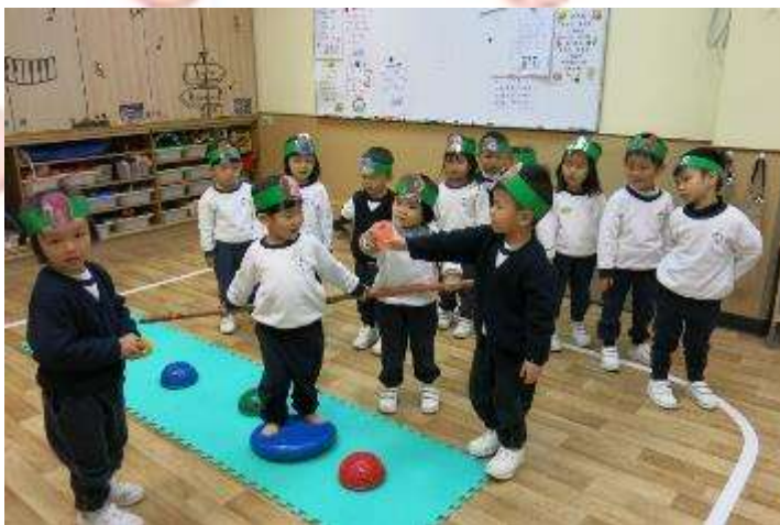
▲ 看我們扮演耶穌釘十字架，耶穌愛我們。