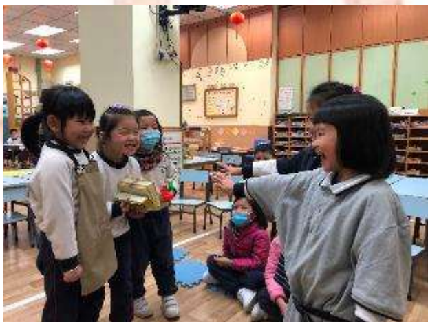
▲ 我們在扮演「耶穌祝福小孩」的故事。