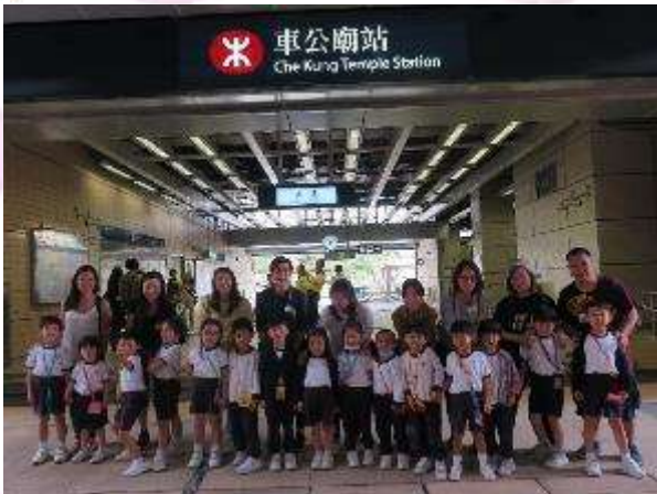
▲ 我們一起搭港鐵，真開心！