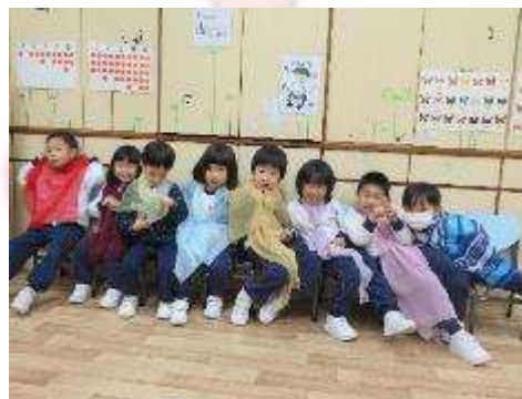
▲ 我們在扮演等候耶穌進城的群眾。