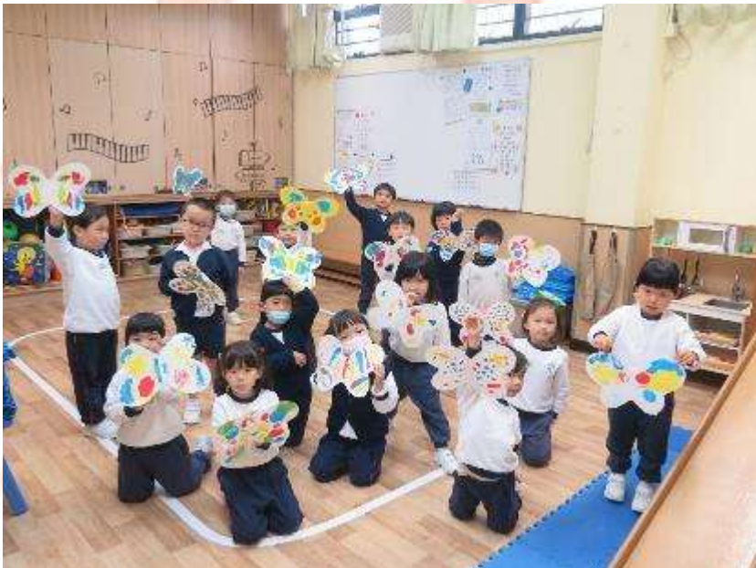
▲ 我們的蝴蝶對稱畫漂亮嗎？