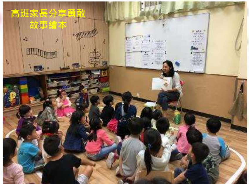
高班家長分享勇敢故事繪本

聖經提摩太後書 1 章 7 節提到「因為神賜給我們，不是膽怯的心，乃是剛強、仁愛、謹守的心。」願每個孩子都得著這從神而來的勇氣，面對成長裡各樣的挑戰！