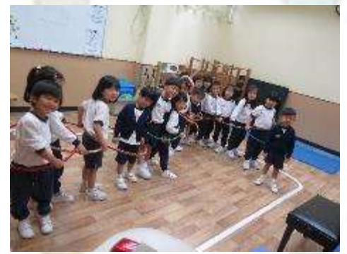
▲ 我們變成了一列火車！