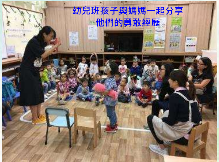
幼兒班孩子與媽媽一起分享 他們的勇敢經歷

三、四月的品格目標是「勇敢」，這期的代表人物是「勇敢小精兵」。為加強孩子對「勇敢」品格的認識，老師花盡心思，設計了「勇敢小精兵」貼紙，也開展了勇敢襟章親子創作設計比賽，同時給予家長到園參予的機會，讓課堂的學習能帶到家中與父母一起實踐。