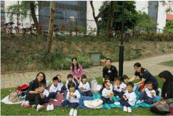
▲ 在沙田公園野餐樂遊遊。