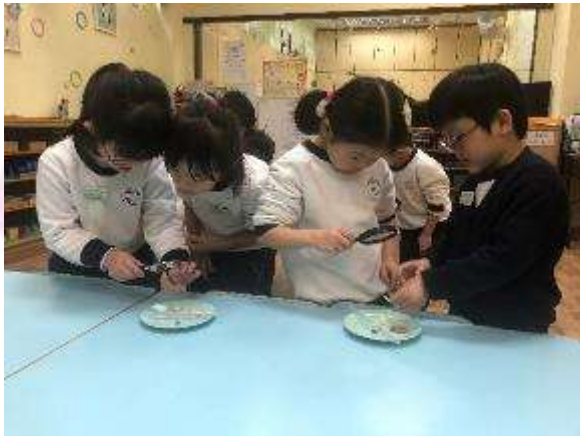
▲ 原來種子是由這樣的結構。 ▼ 農場真好玩。