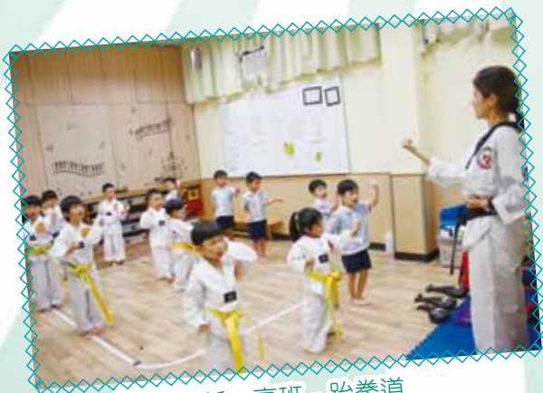
低、高班 - 跆拳道