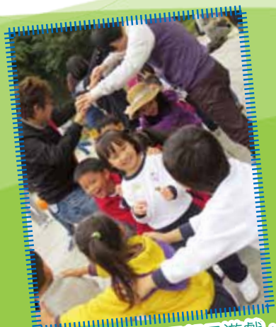
爸媽與我們一起玩親子遊戲，真開心！