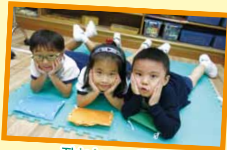
This is my pillow