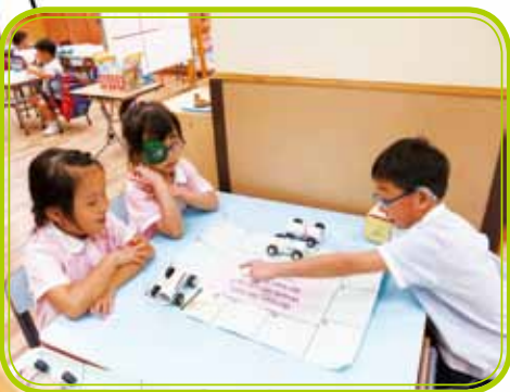
Go-kart, Go-kart, I want a go.