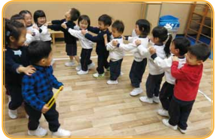
This is our long long train....