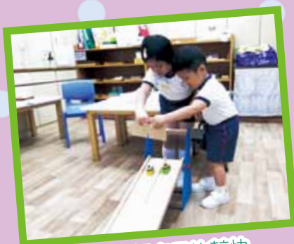
看看哪輛車子比較快