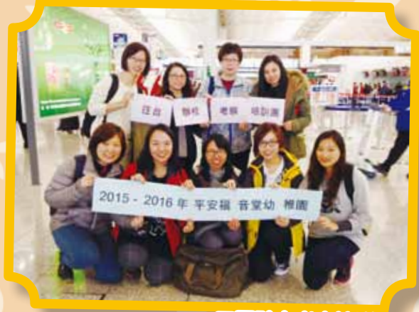
四園訪台考察培訓團