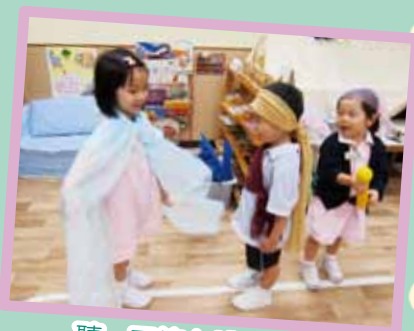
聽 - 天使向腓力說話