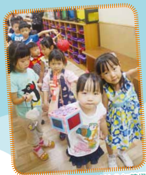
高班同學照顧幼兒班弟妹參加花燈會