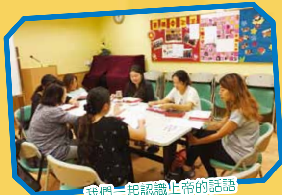
我們一起認識上帝的話語