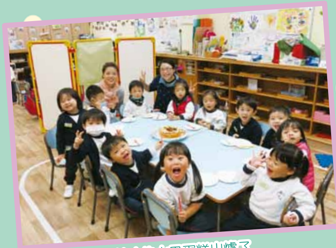
美味的水果蛋糕出爐了