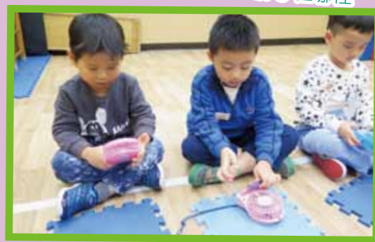
齊齊來探究如何入電池