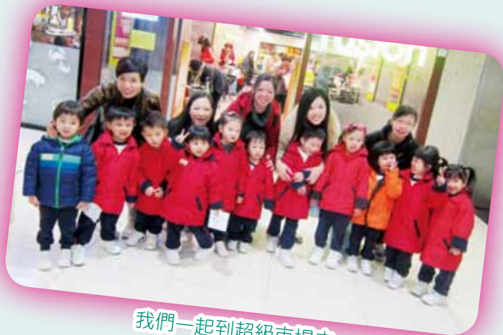
我們一起到超級市場去