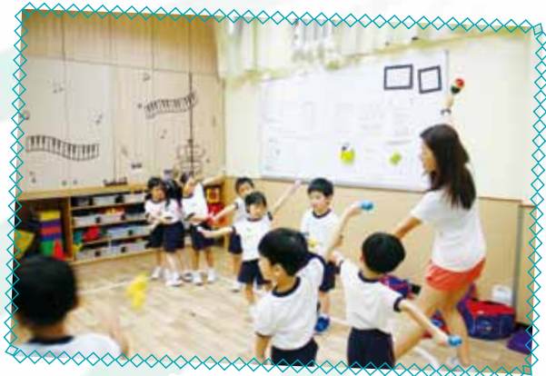
低班 - 趣味節奏樂