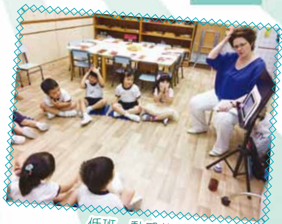
低班 - 動感英語