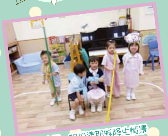
我們一起扮演耶穌降生情景