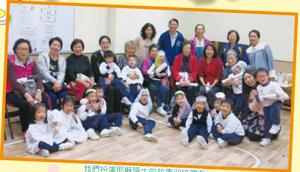
我們扮演耶穌降生的故事迎接親友