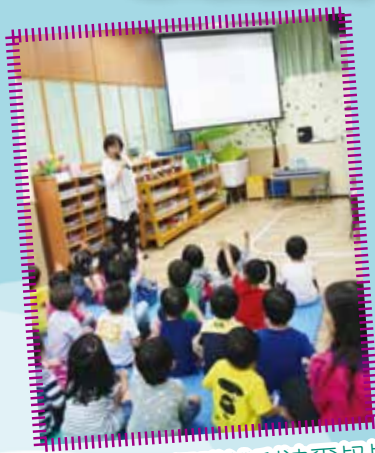
周校長為我們講述利迪爾叔叔的故事