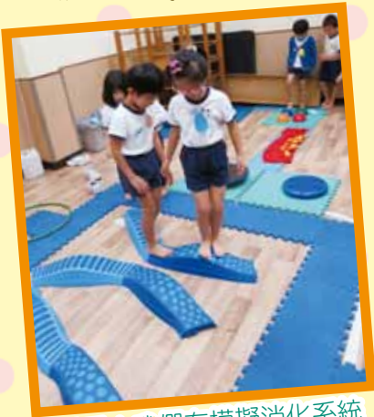
看看！我們在模擬消化系統