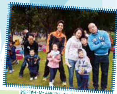
謝謝爸媽與我們一起參加親子遊戲！