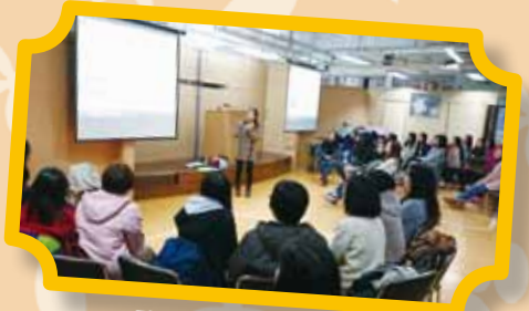
聯園品格教育培訓