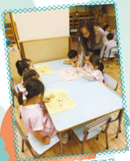
高班 - 強化英語拼音