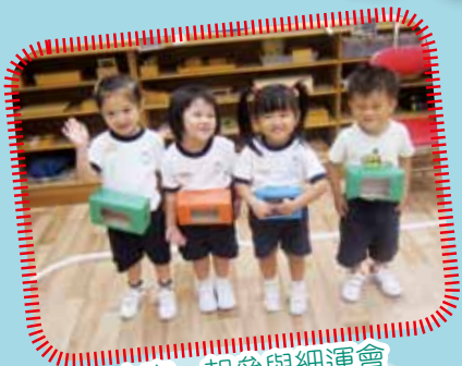
大家一起參與細運會