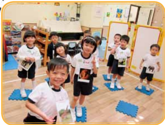
It is on fire... go go go!!