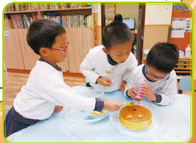
We're baker's man.