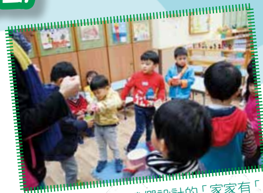
這是高班哥哥姐姐為我們設計的「家家有「米」「米」」的年宵遊戲