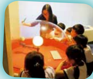
看看我們多留心觀察天父創造的星體。