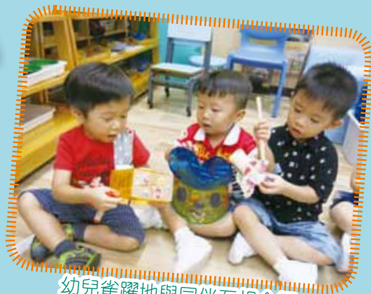
幼兒雀躍地與同伴互相介紹自己創作的花燈