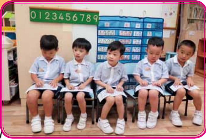
Letter T make the sound 't'