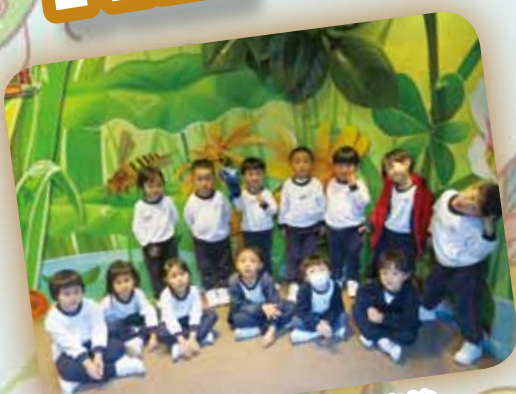
我們一起去參觀昆蟲館