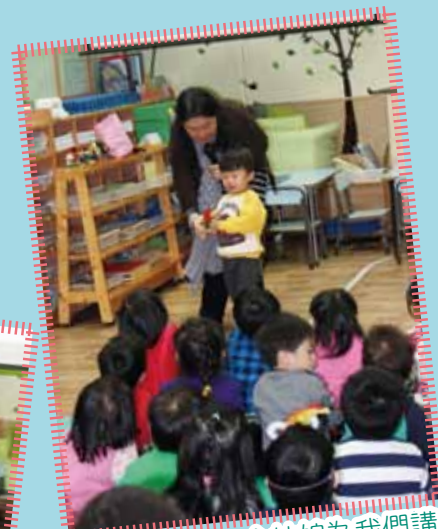
復活節崇拜 - 余姑娘為我們講述復活節的訊息