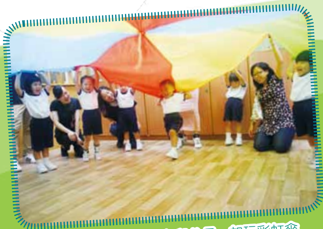
新生適應日 - 小朋友與父母一起玩彩虹傘