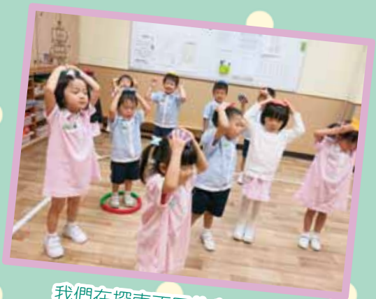
我們在探索不同的身體部位