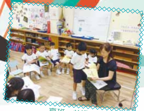
高班 - 普通話