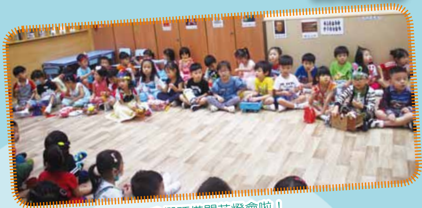
我們預備開花燈會啦！