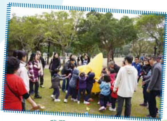
我們一起傳大星星