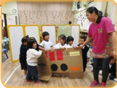
The wheels on the bus go lalalala....