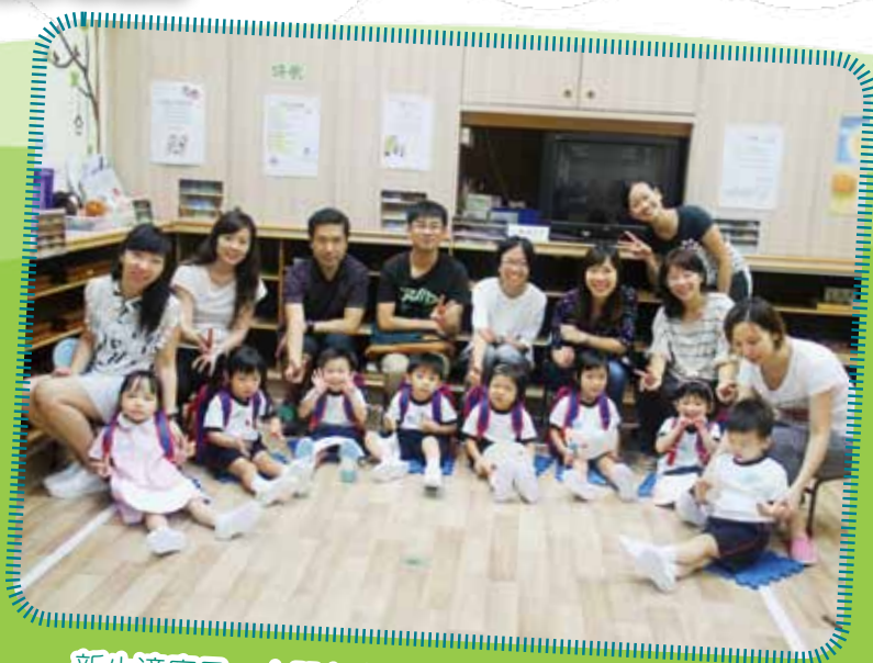
新生適應日 - 小朋友完成第一天的止學來過大合照