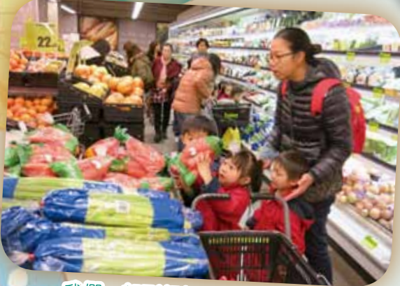
我們一起到超級市場選購蔬菜！