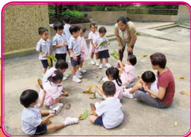
The leaves on the tree are falling down!