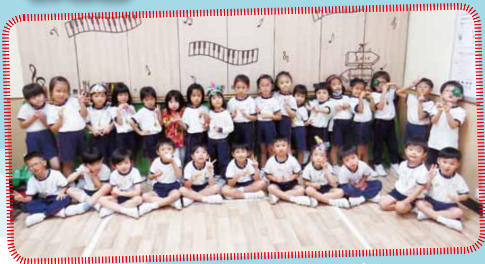
我們努力完成各項項目，來個大合照先！