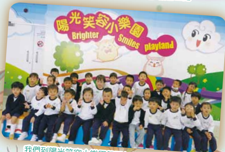
我們到陽光笑容小樂園學習如何保持口腔的衛生