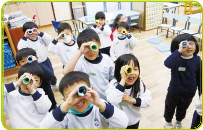
I look up, I look down, I look all around.