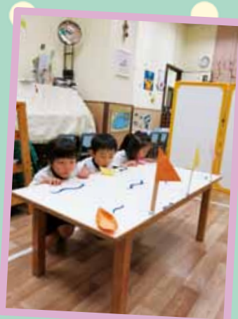
呼~吹船仔大賽正式開始!!!