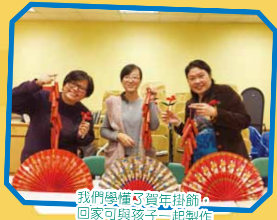
我們學懂了賀年掛飾， 回家可與孩子一起製作