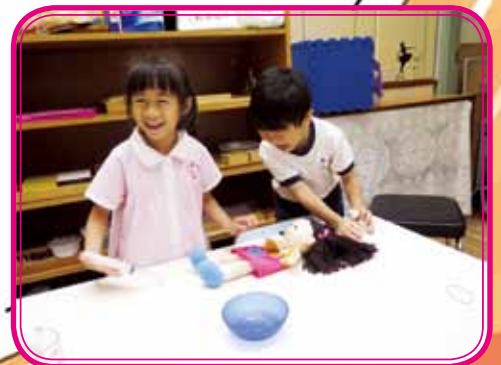
We are good doctors