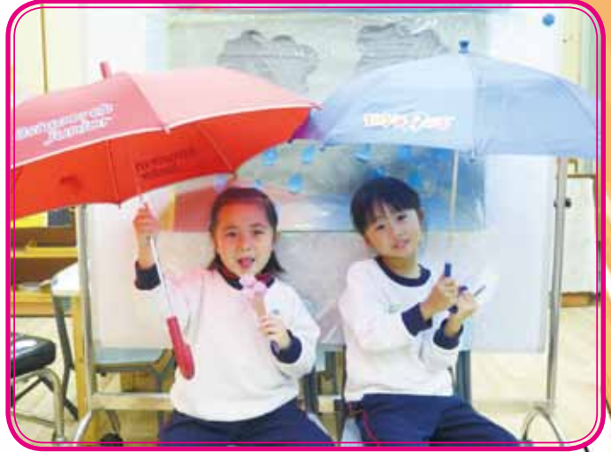
We like ice cream in the rain