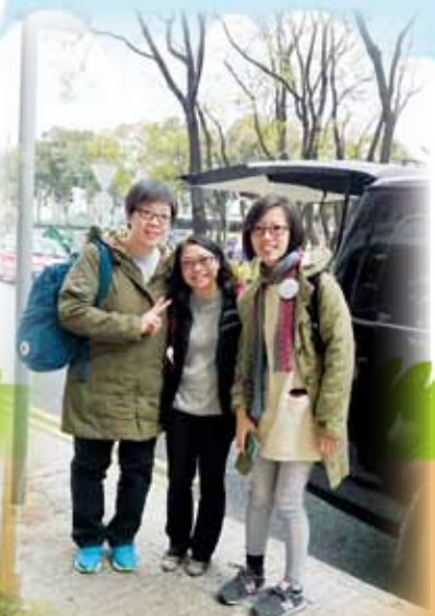
江主任、陳主任、莫主任