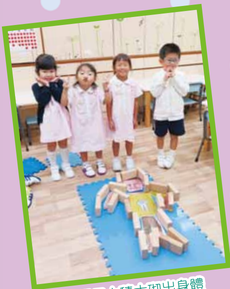
我們用大積木砌出身體