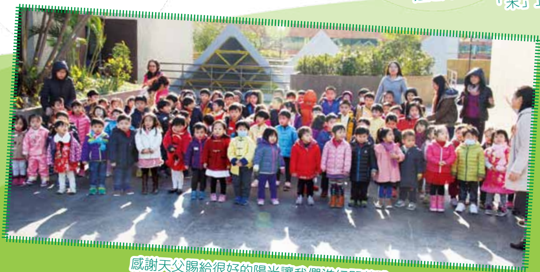
感謝天父賜給很好的陽光讓我們進行開幕禮