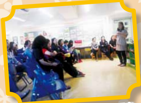
語常會 - 幼兒接觸英語案例研究