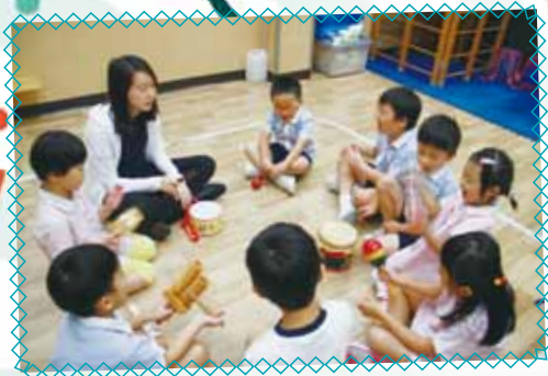
高班 - 趣味節奏樂