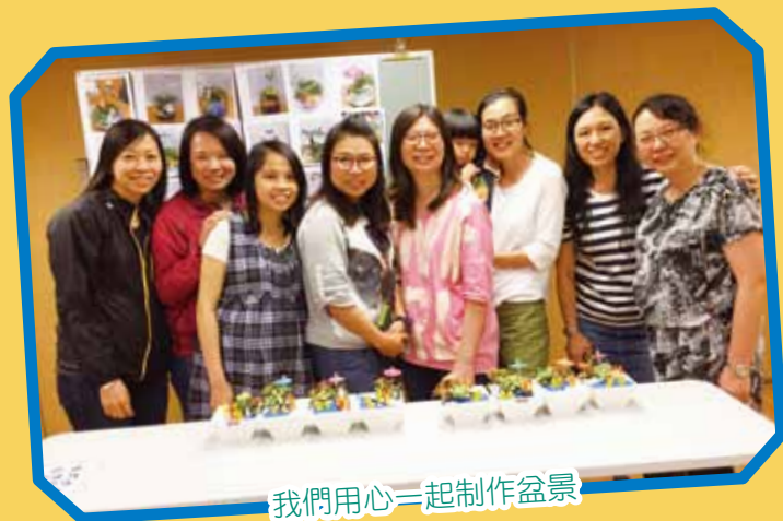
我們用心一起制作盆景