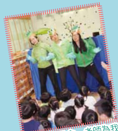
英文日生日會 - 老師為我們落力演出