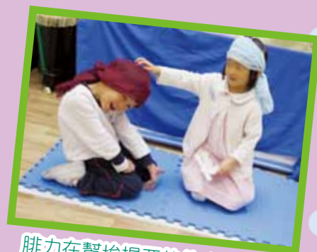
腓力在幫埃提亞伯的大臣受洗