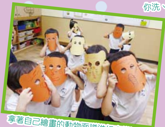
拿著自己繪畫的動物面譜進行音樂活動