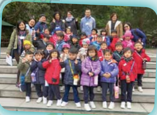
親親嘉道理農場，真開心！