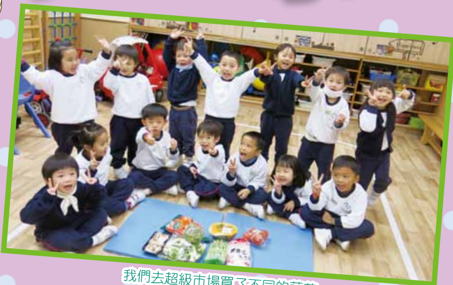
我們去超級市場買了不同的蔬菜