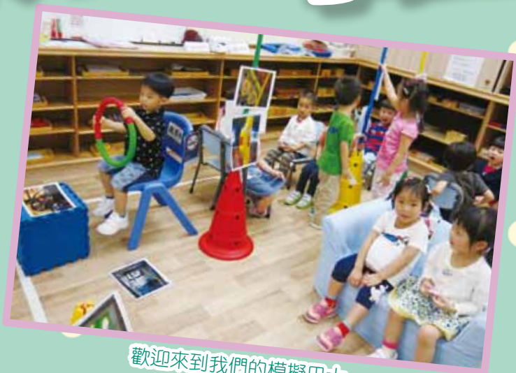
歡迎來到我們的模擬巴士