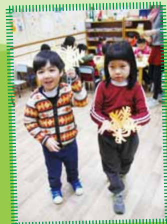
我們在「迎春手工樂」做了立體揮春