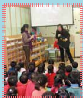
聖誕崇拜 - 余園牧與蔡老師為我們分享耶穌降生訊息