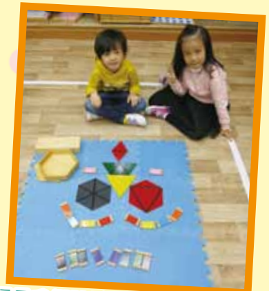
這是我們設計的笑臉，漂亮嗎？