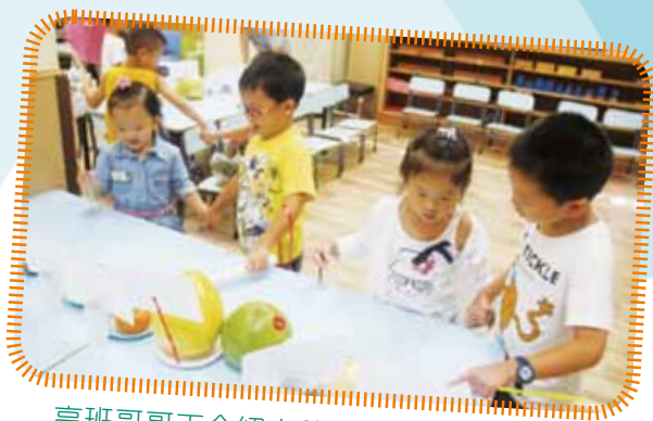
高班哥哥正介紹中秋節食品給幼兒班小朋友認識