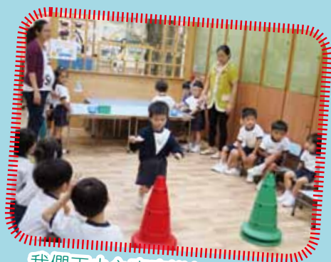
我們正小心奕奕進行運球遊戲