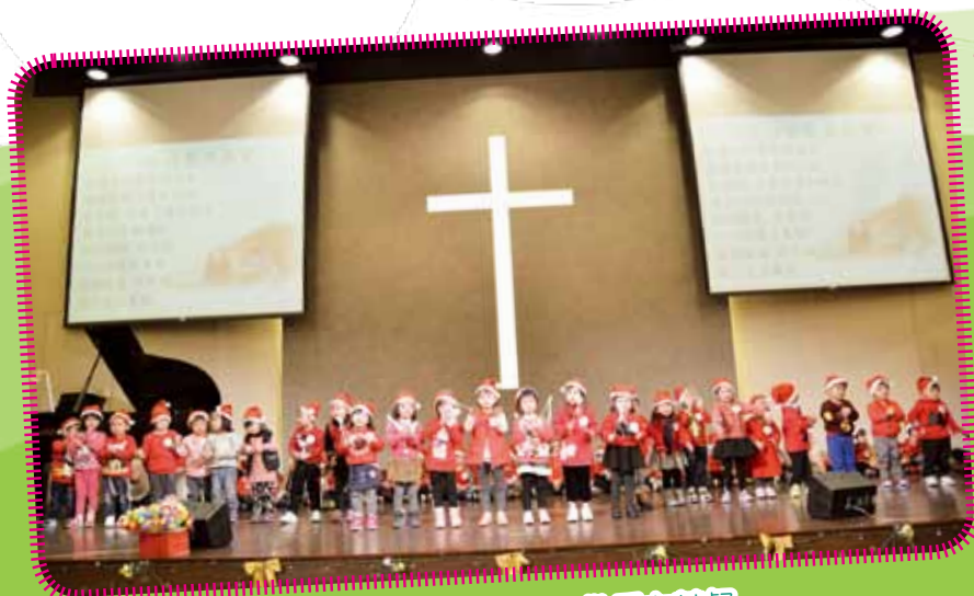
我們為大家獻唱「一心敬愛主基督」