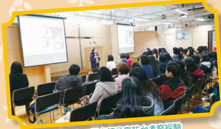
陳主任向四園老師分享訪台考察經驗