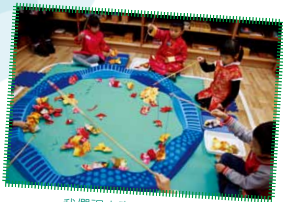
我們祝大家「年年有餘」