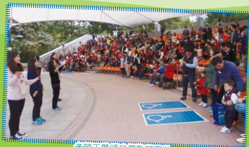
老師正帶領我們敬拜天父