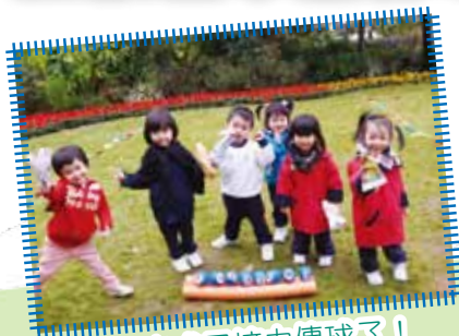
幼兒完成了接力傳球了！