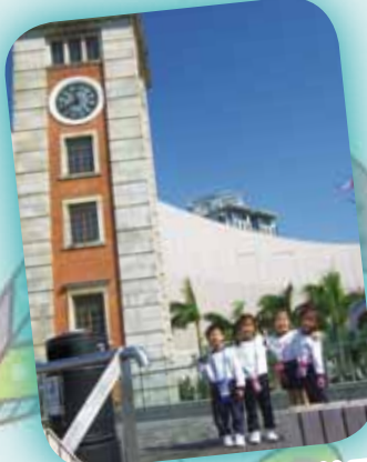
我們跟「鐘樓」一起拍照！