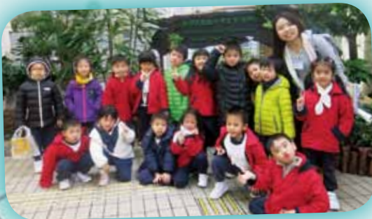
感謝天父創造不同的植物！