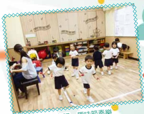
幼兒班 - 趣味節奏樂