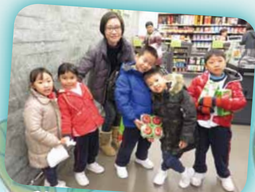
我們到超市購買野餐的食物！