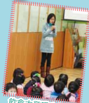
飲食大發現生日會