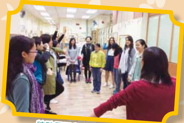
特殊需要兒童支援 (協基)