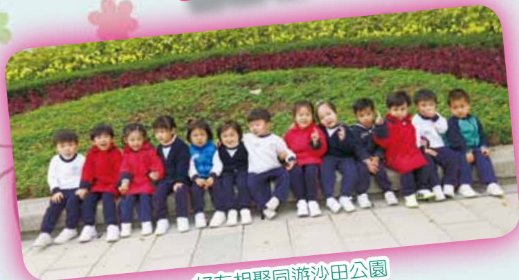
好友相聚同遊沙田公園