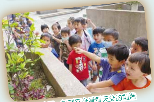
我們一起到平台看看天父的創造