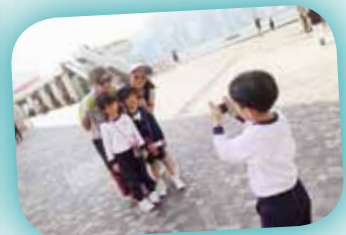
好開心，我學會使用數碼相機了！