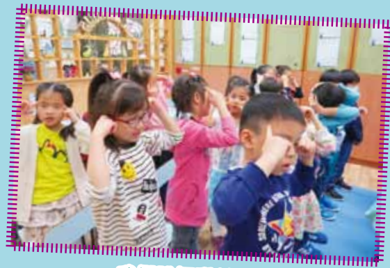
我們跳舞讚美天父