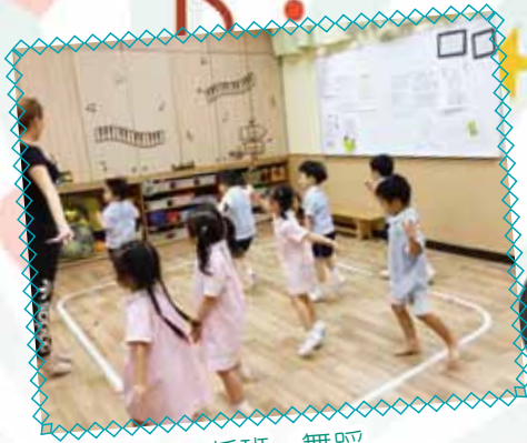
低班 - 舞蹈