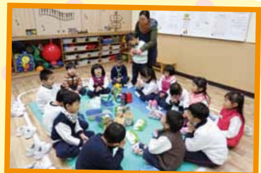
在學校野餐真快樂！