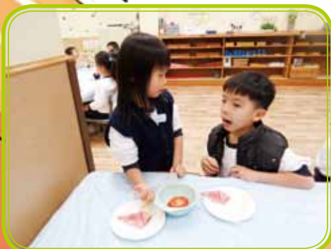
Would you like a sandwich ?