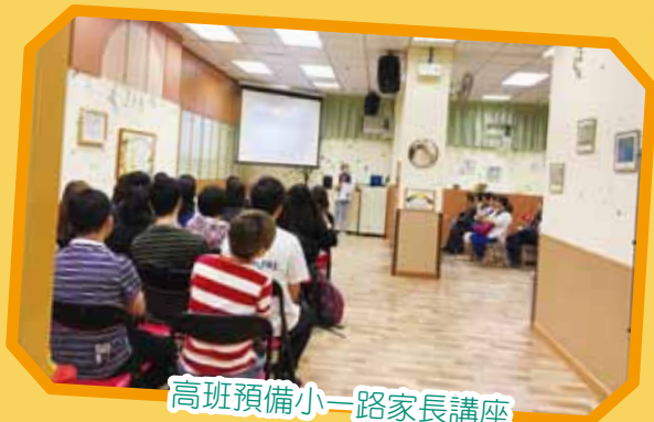
高班預備小一路家長講座