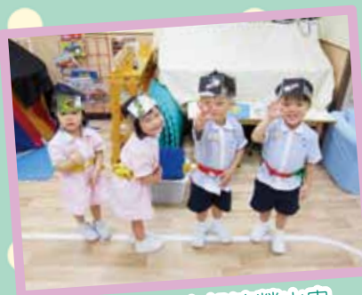
你看！我們在扮演螢火蟲