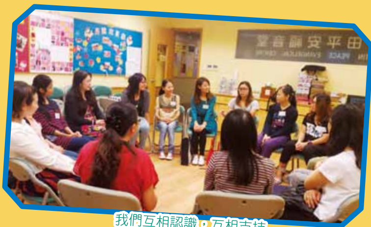
我們互相認識，互相支持