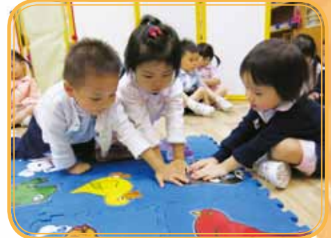
We found Black Sheep, Yeah!!!