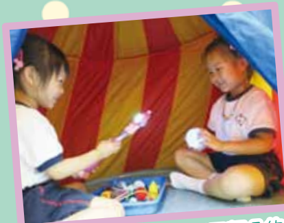
我們發現原來光有不同顏色的