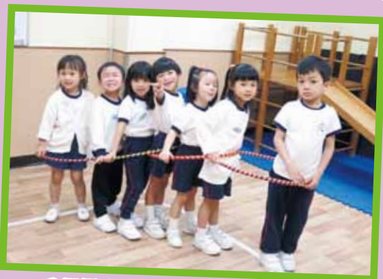
我們變成了一列火車，轟隆！轟隆！