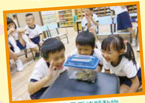
哇！田雞是兩棲類動物。