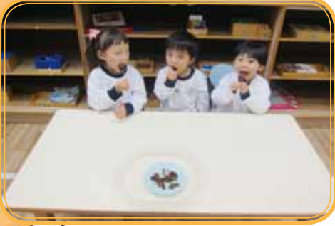
Let's taste the cake ! YUMMY