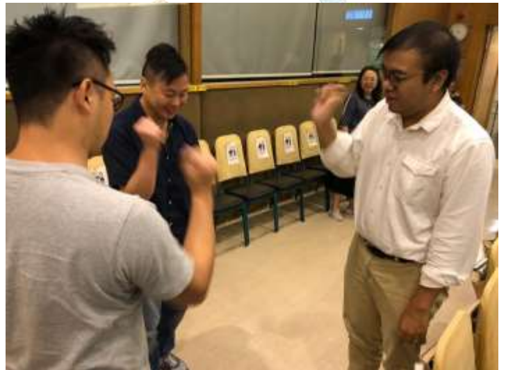
▲ 6A 講座家長都投入參與。