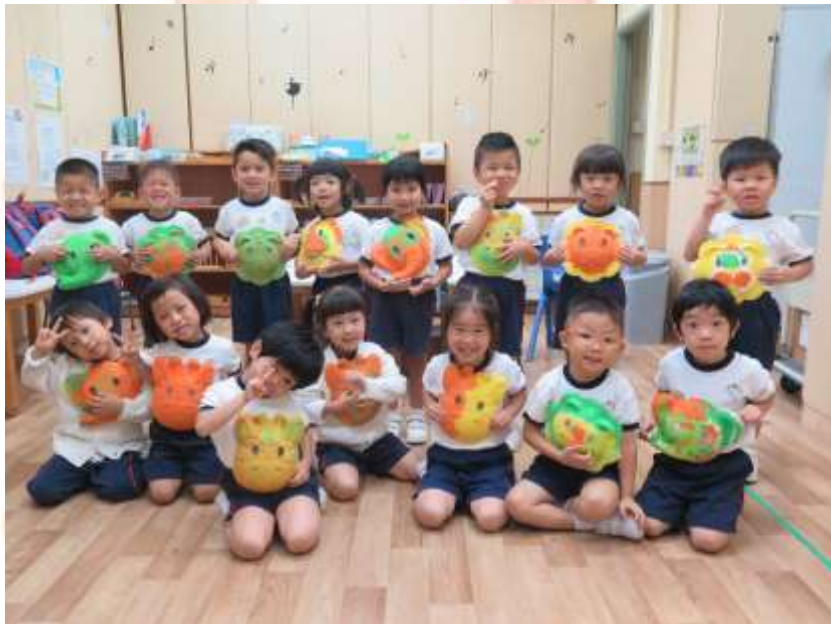
我們製造的動物面譜漂亮嗎？