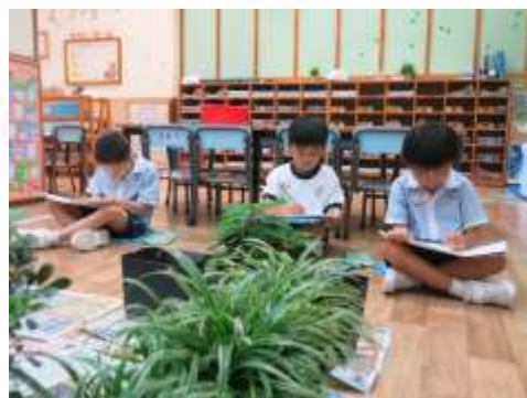
◀ 看看！我們多認真地寫生。