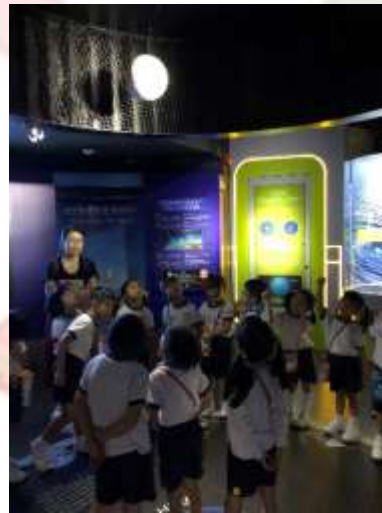
◀ 嘩！原來月相變化是這樣形成的！