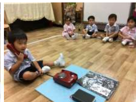
✔ 學習打電話給天父！