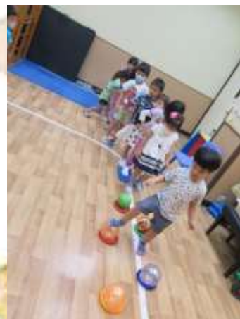
我的身體會做單腳企的動作啊！