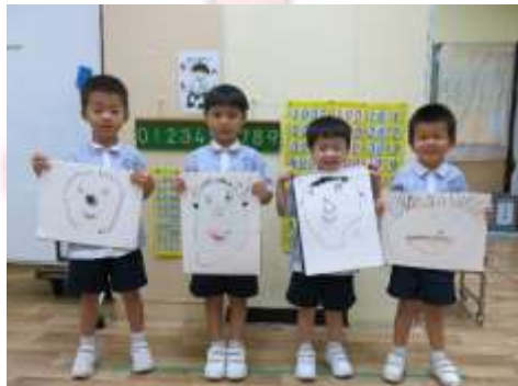
這是我的自畫像，真可愛！