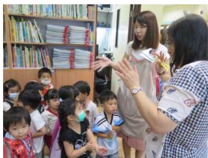
▲ 親親校園日，認識校園的人物。