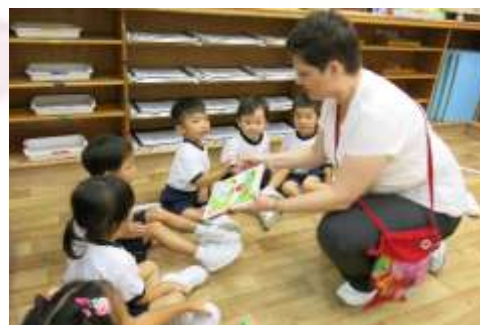
◀ 愉快的英語外籍課。