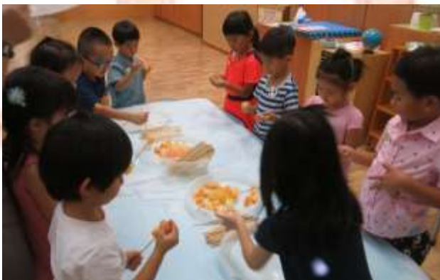
▲ 我們專心地為弟弟妹妹製作水果串。