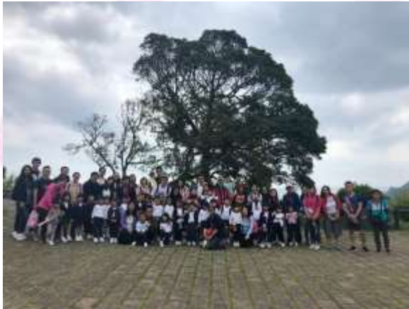
▲ 真開心，家人陪我去旅行。 ▼ 我們很喜歡天父的創造。