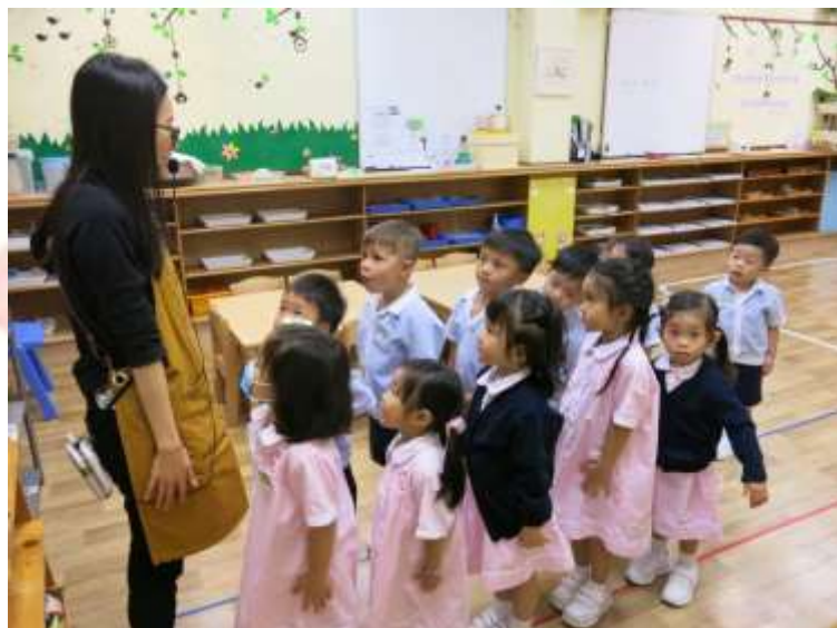
▲ 齊來學排隊，看我們多整齊！