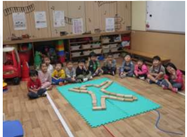
我們用大積木砌出身體。