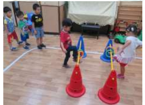
我能夠單腳站立玩遊戲啊！