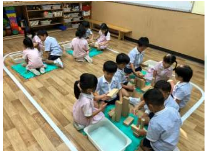
▲ 用積木建造房屋，真好玩啊！