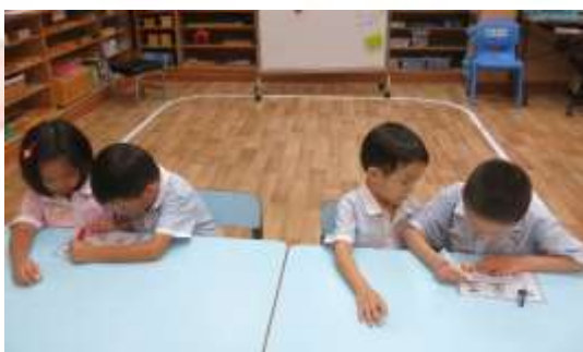
▲ 「日」部首可以造成不同的文字。