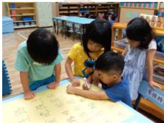
◀ 課堂規則是很重要的。