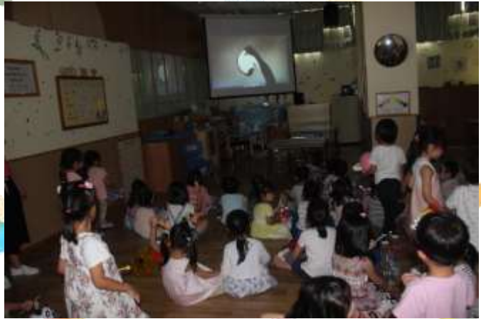
▲ 透過沙畫我們知道更多中秋節的故事！