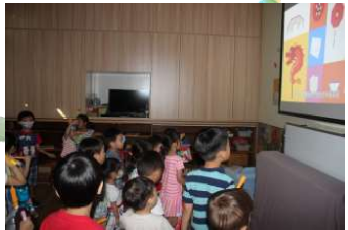
▲ 我們一起看有關中秋節的短片！