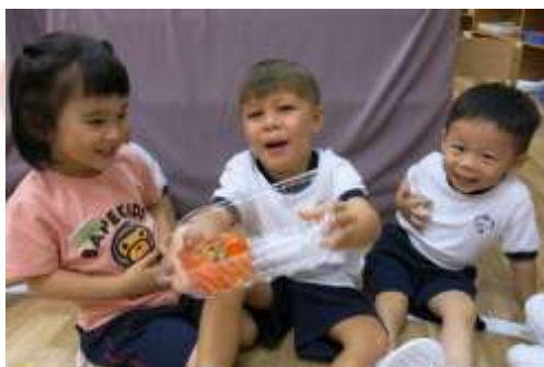
✔ 認識中秋節的水果，這是柿子啊！