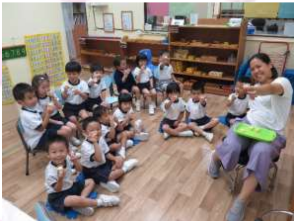
Let's drink mango milkshake!