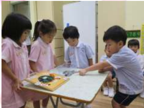
烏龜是哺乳類動物，它在爬呀！