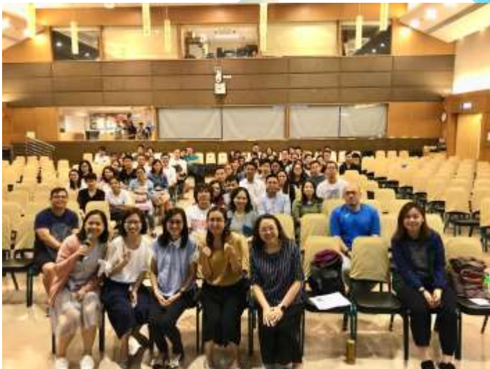
▲ 6A 講座大合照。