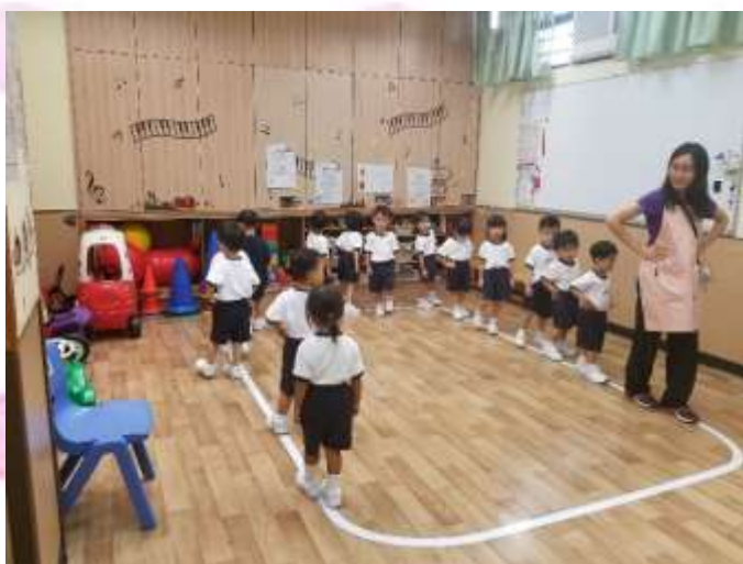
▲ 我們正在專心地走線呢！