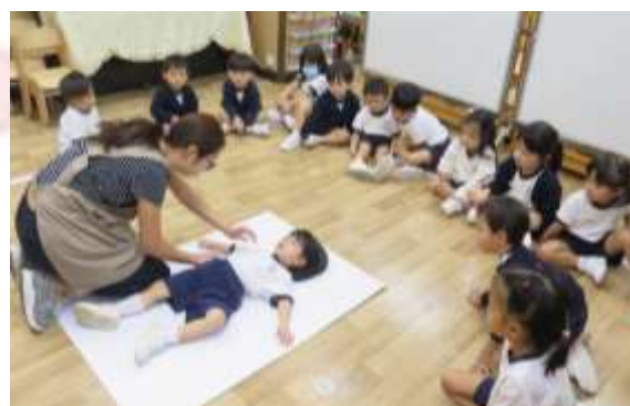
▲ 繪畫身體繪圖，我們都是獨特的！